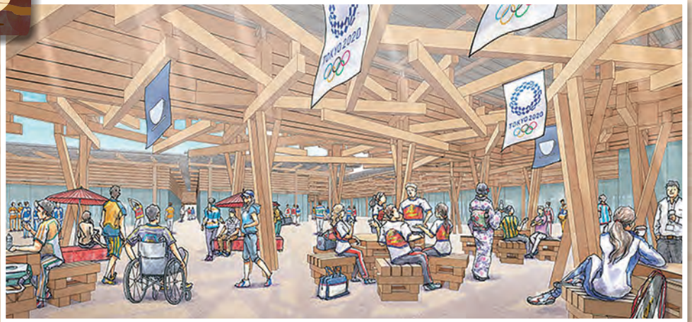
選手村ビレッジプラザの内観イメージ 2018年10月時点のイメージ

(選手村ビレッジプラザとは、メディアをとおして人の目にふれる選手村の代表的な施設のことです。)