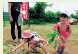
旬の野菜を収穫できるよ

とき・ところ 6月8日(土)午前9時JAはだの上支所(菅蒲1393-1)集合～午後2時(受け付けは午前11時まで) ※荒天のときは9日(日) 定員 100組(当日先着順) 費用 1000円(体験チケット3枚つづり)