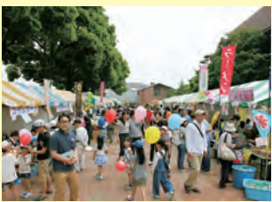
多くの模擬店でにぎわう

内容 ◆両日開催 商工品の即売、工業製品の展示、抽選会、子供ショー、パザー、フリーマーケット、子どもの科学広場、諏訪物産展、竹細工教室、住宅・プロパンガスの相談など ◆25日 献血、盛岡さんさ踊り、よさこい踊り ◆26日 ラッパ鼓隊演奏、和太鼓演奏、キッズサイエンスショー