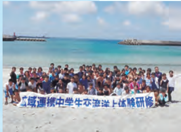
自然の中で貴重な体験をする3日間

※海洋状況により変更あり 対象 市内在住の中学生50人(申し込み先着順) 費用 1万8000円 申し込み 申込書(市役所教育庁舎1階生涯学習課、公民館、はだのこども館、市ホームページなどにあります)を5月31日(金)までに〒257-8501生涯学習課へ郵送または持参 ※持参者優先