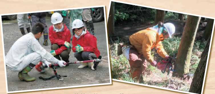
研修終了後は、団体または個人ボランティアとしての活動をお願いしています。