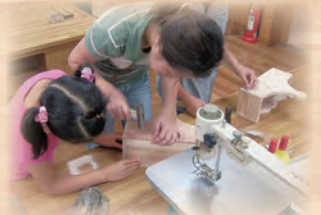
親子木工体験の様子

また、電動工具の使い方や制作方法について、指導員のアドバイスを受けることができます。