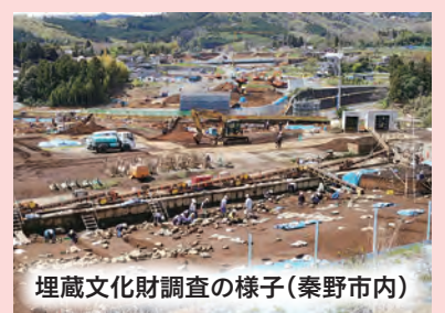
埋蔵文化財調査の様子(秦野市内)

新東名高速道路(海老名南JCT～御殿場JCT間)は開通時期を2020年度として、建設工事が進められていましたが、令和元年8月下旬にその見直しが発表されました。