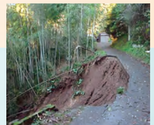
台風第19号の影響で上地区の道路が崩壊