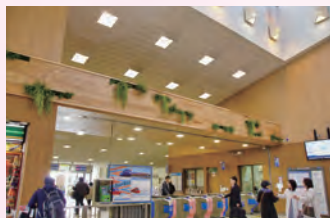
丹沢の玄関口の魅力を高める渋沢駅