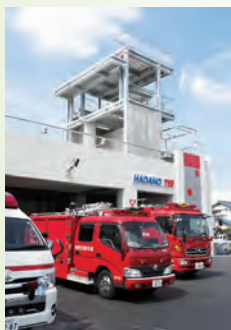
救急需要の増加に対応する消防署西分署