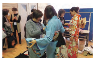
日本の伝統文化に触れる

時2月16日(日) 午前9時45分～午後1時 場本町公民館 内外国籍市民の日本語スピーチ大会、交流会、茶道・着付け体験、各国紹介ブースなど 定150人 費200円 問文化振興課☎(86)6309