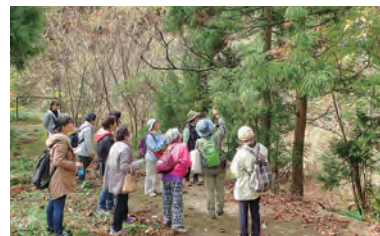
自然の中でリフレッシュ

時2月15日(土) 午前9時～午後2時半 場表丹沢野外活動センター 内植物観察、ほうじ茶作り、ハンモック体験など 定20人 費3000円 ※昼食あり 申電話またはメール(k-kyousei@) 問環境共生課☎(82)9631