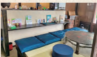
新設されたカフェスペースで 日本茶体験

時 2月17日(月) 3 月9日(月) 23日(月) 午前10時半~11時 半 場 立花屋茶舗 (本町3-4-23) 定各回4人 費 4 000円 申 ☎(81) 0334(午前9時 ~午後6時)