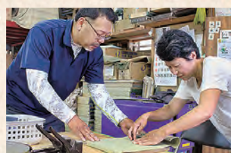
天然イ草の効果も学べる

時 2月22日(土) 午 前9時半~11時半 場 秦野豊工房(根倉 たみ店・入船町 1-14) 定6人 費 10000円 申 ☎0120(0)01 7(193(午前9 時~正午)