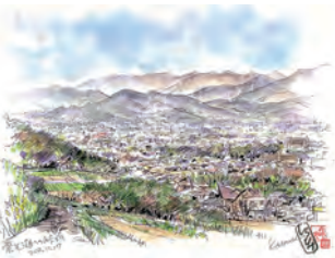
丘陵からのスケッチ

3月1日(日)午前9時 秦野駅改札前集合～バス～秦野総合高校前～白笹稲荷神社～午後3時半 定員 20人(申し込み先着順) 費用 3000円