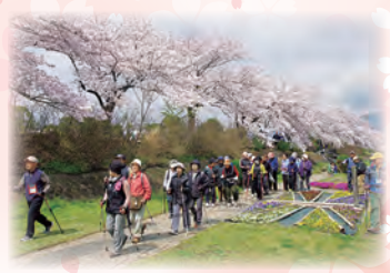
桜並木をウォーキング

申し込み 応募用紙(市ホームページにあります)を市役所西庁舎1階産業振興課へファクス((82)6256)または持参。メール(sangyou@city.hadano.kanagawa.jp)も可