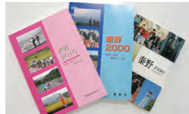
10年ごとに発行される

撮影期間 1月1日～12月31日 申応募写真のデジタルデータを記録したCD-Rに応募用紙(桜土手古墳展示館、公民館などにあります)を添えて、令和3年1月15日(金)までに〒259-1304 堀山下380-3桜土手古墳展示館内生涯学習課へ郵送または持参(CD-Rは返却しません) 問生涯学習課☎(87)9581