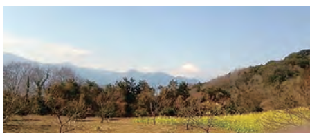
富士見の尾根で絶景を

とき・ところ 3月11日(水)午前9時 矢倉沢駅改札前集合～午後3時開成駅 ※雨天中止 定員 50人(申し込み先着順) 費用 500円