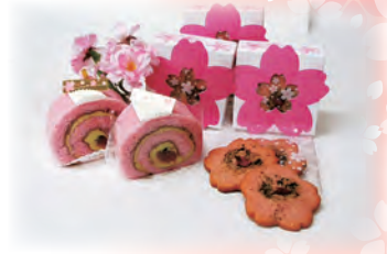
桜スイーツや商品も