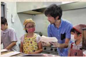
生地からピザ作りに挑戦