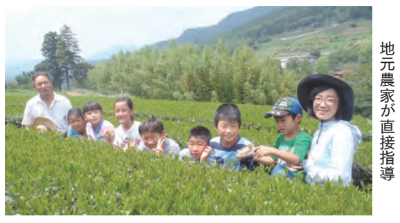
地元農家が直接指導

とき 8月24日(月)～28日(金) 午前9時半～正午 ところ 市内の農家 ※農家宅へは保護者による送迎 説明会 8月17日(月) 午後3時～ JAはだの本所 対象 小学4～6年生15人(抽選) 申し込み 往復はがきに氏名、性別、学校名、学年、保護者の氏名、住所、電話番号、希望日、部門(畜産、野菜、果樹、花、茶)の第1～3希望を書き、7月27日(月)までに〒257-0015平沢477はだの都市農業支援センターへ郵送