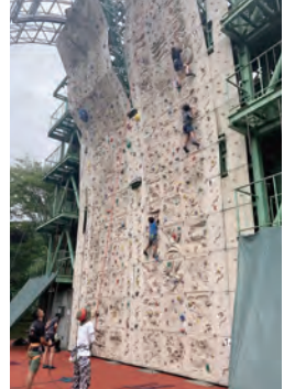
高い所まで登れるかな

とき 8月20日(休)、21日(金)、24日(月)、25日(火)の全4回 午前9時～11時 ところ 県立山岳スポーツセンター 対象 小学3～6年生20人(抽選) 費用 5000円 申し込み 7月17日(金)～23日(休)