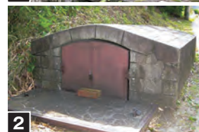
秦野の水道の歴史を感じられる口号水源