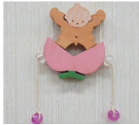
自分だけの作品を作ろう