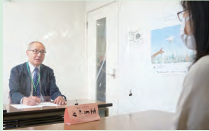
相談員が親身に対応

会場は、 市 =市役所 保 =保健福祉センター 農 =秦野駅前農協ビル3階 ば =市地域生活支援センターぱれっと・はだの(本町2-7-25)。各相談とも、祝・休日はお休みします。