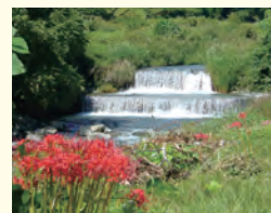
上地区の自然に触れよう