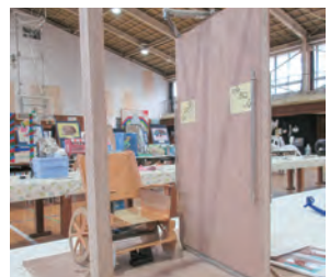
アイデア作品を募集