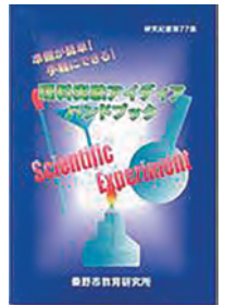
夏休みの自由研究に