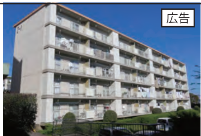
小田急小田原線「東海大学前」バス7分 徒歩2～10分