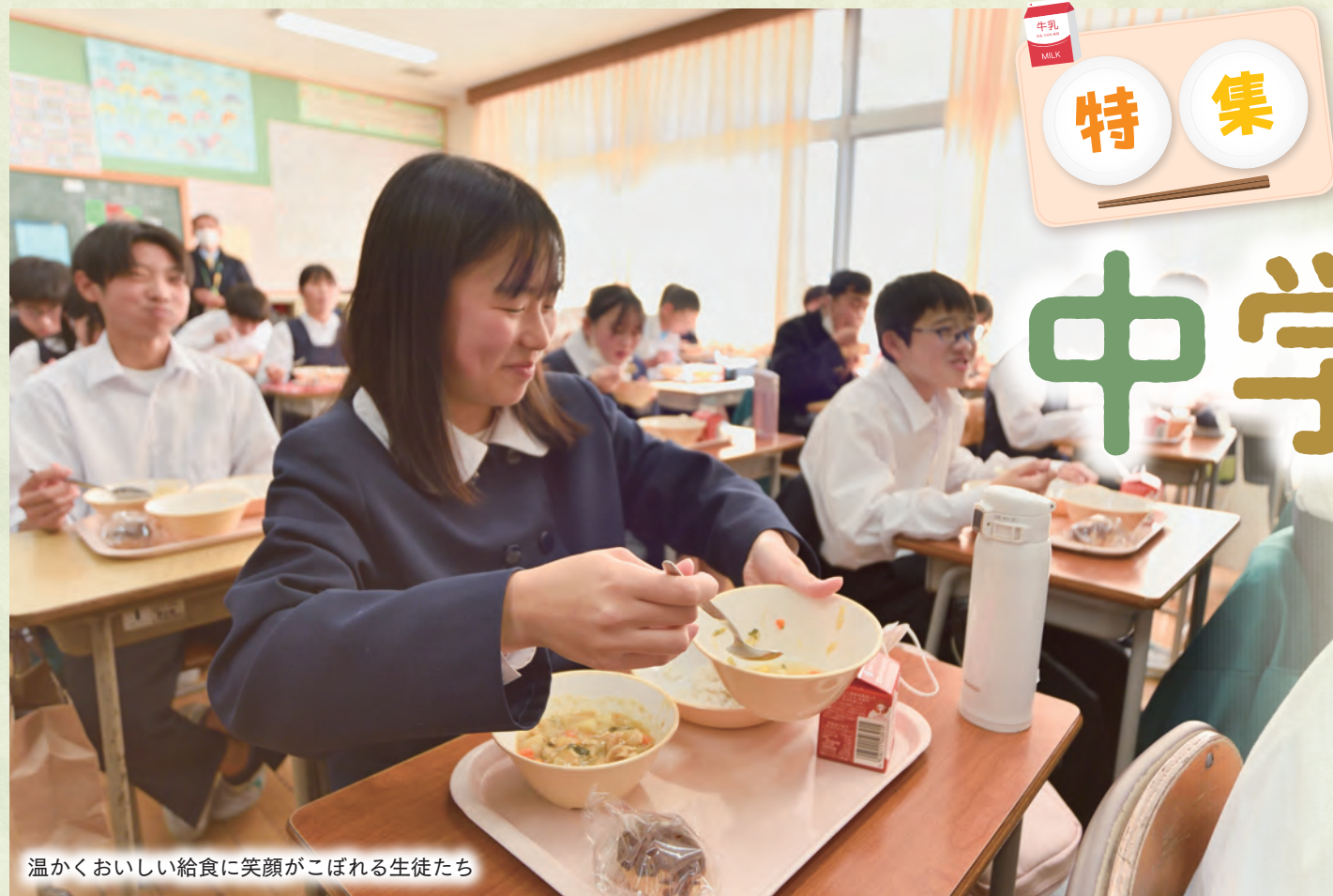
温かくおいしい給食に笑顔がこぼれる生徒たち

Q. 将来に向けて工夫したことは？ A. 倉庫として設置している部屋は、盛り付け室へ変更が可能な設備となっており、生徒数が減少したときには高齢者向けの配食サービスの提供ができるなど、他事業への活用も見据えた設計になっています。