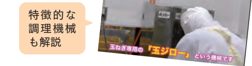
特徴的な調理機械も解説