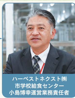
積み上げた経験で 最高の給食センターを

93・2%と44・5%。これは平成30年度の全国と県内の公立中学校の完全給食実施率です。市では保護者などをはじめ、以前から中学校給食を要望する声が増えていました。そうした中、市政の重要施策の一つとして、平成30年度から保護者や市民、学識経験者や小・中学校の代表者などさまざまな立場の方と共に白紙の段階から検討・準備を進めてきました。当時の生徒会役員からの思いがこもった意見は、プロジェクトの原動力となりました。新たなチャレンジの連続でしたが、生徒や保護者の意見を取り入れた「秦野スタイル」として、中学校給食をこれほど短期間でスタートできたのは、皆が一丸となって取り組んだからだと思います。 学校給食は幅が広く奥が深いです。たくさんの人たちがはだのっ子を思い、努力を重ねて毎日の給食が届けられています。これからは市民の皆さんと共に、地域社会全体ではだのっ子を育み、学校給食全体を充実・発展させていきたいと考えています。