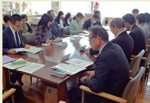
市PTAや学識経験者、学校関係者など多くの人が議論を重ねてきた

その過程では、事業者を選段階から秦野独自の工夫を凝らした。市が目指す「質の高い中学校給食」を、民間事業者の高い技術力や創意工夫を生かして実現したい思いがあったからだ。市は具体的な条件を示した中で、設計や建設、調理運営といった全ての工程を一括発注し、それぞれの専門事業者がチームを組んで受注する秦野独自の方式とした。そうした新しい視点が、みんなの思いが詰まった学校給食センターの早期実現につながった。