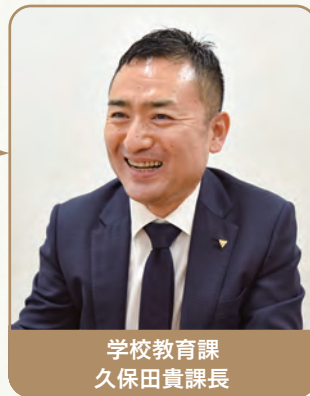
市民が育む はだのっ子と学校給食

93・2%と44・5%。これは平成30年度の全国と県内の公立中学校の完全給食実施率です。市では保護者などをはじめ、以前から中学校給食を要望する声が増えていました。そうした中、市政の重要施策の一つとして、平成30年度から保護者や市民、学識経験者や小・中学校の代表者などさまざまな立場の方と共に白紙の段階から検討・準備を進めてきました。当時の生徒会役員からの思いがこもった意見は、プロジェクトの原動力となりました。新たなチャレンジの連続でしたが、生徒や保護者の意見を取り入れた「秦野スタイル」として、中学校給食をこれほど短期間でスタートできたのは、皆が一丸となって取り組んだからだと思います。 学校給食は幅が広く奥が深いです。たくさんの人たちがはだのっ子を思い、努力を重ねて毎日の給食が届けられています。これからは市民の皆さんと共に、地域社会全体ではだのっ子を育み、学校給食全体を充実・発展させていきたいと考えています。