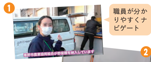
職員が分かりやすくナビゲート