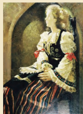
YUGOSLAVIA 宴 昭和48年

これは、フラメンコの連作から一転、ヨーロッパの民族衣装をまとった美しい異国の女性を描くようになった宮永の言葉。これまで培ってきた「モード」の感性を封印し、悠久の美への一歩を踏み出しました。この作品のモデルは、日本で英語教師をしていたアメリカ人女性。逆光に輝くブロンドの髪と美しい肌に強いインスピレーションを感じた宮永は、彼女が帰国するまでの5年間、モデルとして描き続けました。