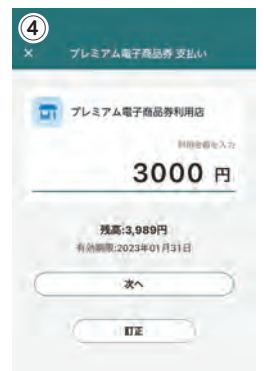
※画面はイメージです