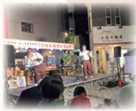
ライブ演奏を楽しみながら

とき 11月20日(日) 午前11時～午後7時 ところ 鶴巻温泉駅 北口広場周辺 内容 ジビエ料理などの販売、ステージイベントなど