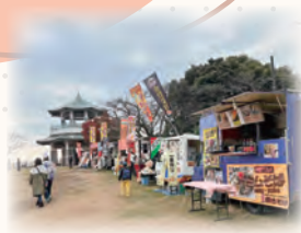
紅葉ハイキングとおいしい秋に大満足

とき 11月26日(土) 27日(日) 午前10時～午後3時半 ところ 弘法山公園 内容 キッチンカー、スタンプレリー