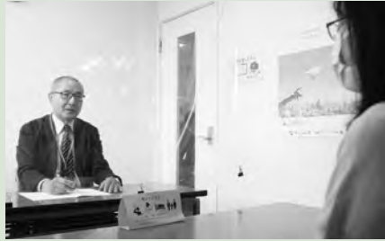
相談員が親身に対応

会場は、 市 =市役所 保 =保健福祉センター 農 =秦野駅前農協ビル3階 ば =市地域生活支援センターぱれっと・はだの(本町2-7-25)。各相談とも、祝・休日はお休みします。