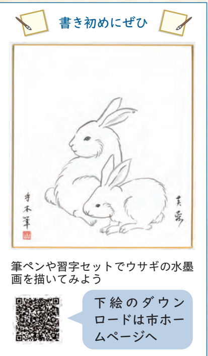
筆ペンや習字セットでウサギの水墨画を描いてみよう 下絵のダウンロードは市ホームページへ

1 平成29年の第47回市美術協会展新人賞を受賞した作品「生命力」。水墨画を始めて間もない頃に描く。実家の庭にある木の生命力を表現した 2 復興大臣賞の受賞作品「SON」。全国での度重なる災害に影響を受けて、作品を描き始めた。声にできない心のつらさの解放などを描く