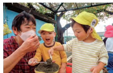
子供たちに囲まれて働こう

①保育教諭 内保育業務 対幼稚園教諭および保育士の資格がある方 数70人程度 日週2～5日 午前7時半～午後7時で交代勤務 ②事務員 内事務業務 数5人 日週3～5日 ③業務員 内清掃業務、給食調理補助など 数8人 日週3日 ④預かり保育事業保育員 内預かり保育業務 対幼稚園教諭または保育士の資格がある方 数2人 日週2～3日 ⑤給