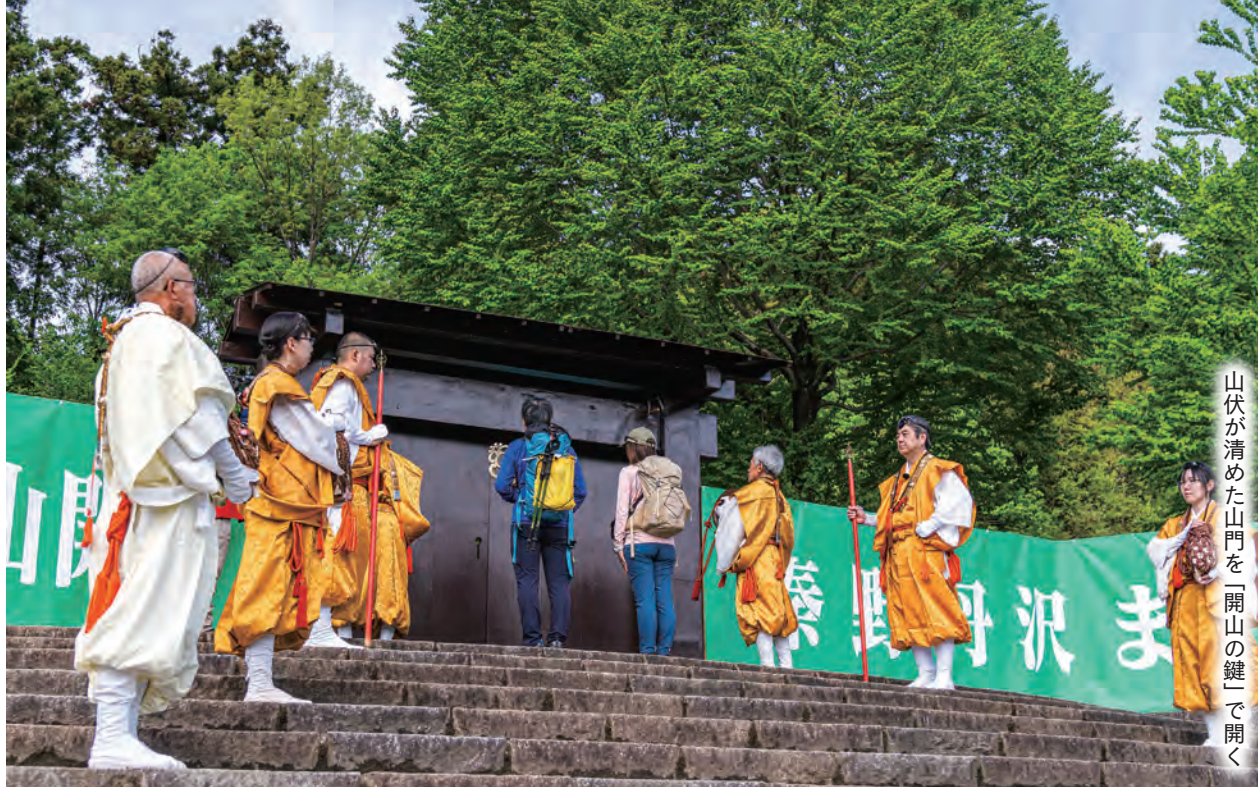
山伏が清めた山門を「開山の鍵」で開く