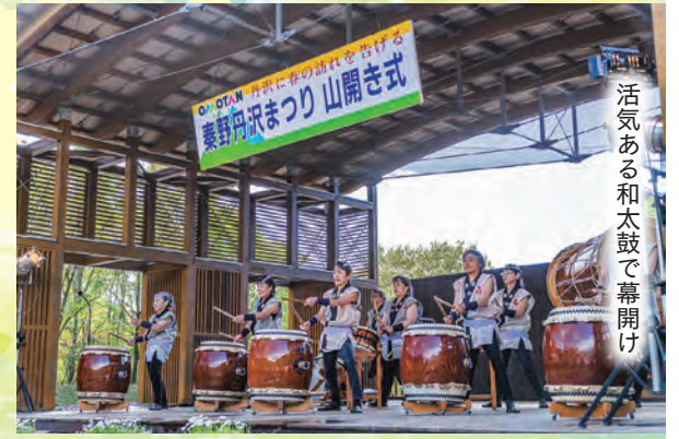
活気ある和太鼓で幕開け