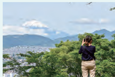
低山から本格登山まで

スマートフォンアプリ「ヤマスタ」を使ってチェックインポイントを巡りデジタルスタンプを集めると、記念缶バッジや認定証がもらえます。さらに、コース達成ごとにピンバッジと、今年から景品に追加される特製手拭いの抽選に応募できます。