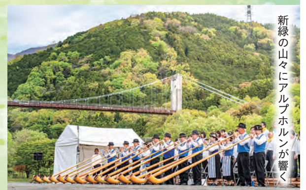
新緑の山々にアルプホルンが響く