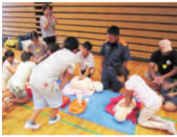
人形を使って体験

とき 7月25日(火) 午前10時～11時半 ところ 保健福祉センター 内容 心肺蘇生法、AEDの使い方など 定員 市内在住・在学の小学4～6年生40人(申し込み先着順) ※保護者も参加可。参加者には、修了証を発行 AEDの貸し出しをしています 夏休みのイベントなどで積極的にご利用ください。