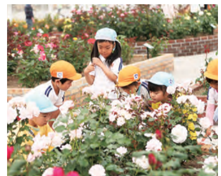
どんな香りだろう