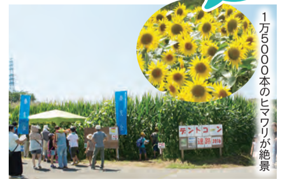
1万5000本のヒマワリが絶景

高さ2m以上のデントコーン(飼料用のトウモロコシ)で作った迷路。今年は、隣のヒマワリ畑も楽しめます。家族や友達と挑戦してみませんか。 ところ 田原ふるさと公園隣(東田原 961・962)