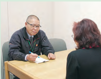
相談員が親身に対応

会場は、 市 =市役所 東 =東海大学前駅連絡所 保 =保健福祉センター 西 =西公民館 鶴 =鶴巻公民館 ほ =ほうらい会館 農 =秦野駅前農協ビル3階 す =地域活動支援センターすみれ(今川町2-15-602) 地 =市地域生活支援センター(本町2-7-25)。各相談とも、祝・休日はお休みします。