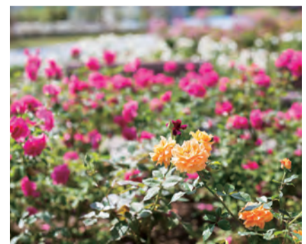
バラのライトアップは今年初