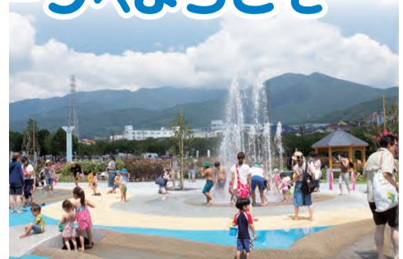
通常の2倍、3mの高さまで噴射

カルチャーパークでは、じゃぶじゃぶ池のポップアップ噴水の山盛り噴射や夏の夜バラのライトアップなど、山の日を記念したイベントが盛りだくさん。家族や友達と一緒に出かけませんか。