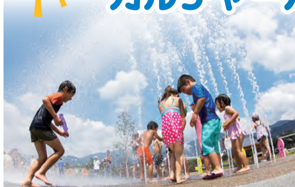
青空の下で大はしゃぎ