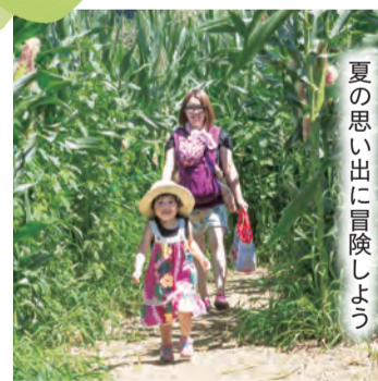
夏の思い出に冒険しよう