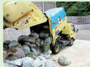
試行(6月~8月)を実施した結果、約9トンの草類を資源化しました。ご協力ありがとうございました。

分別収集が始まるまでは、数日間乾燥させて水分をとり、可燃ごみとして出してください。