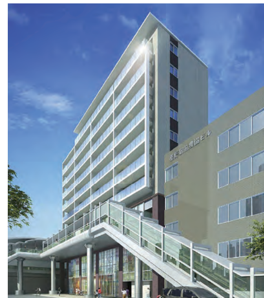
新たな活気生まれる