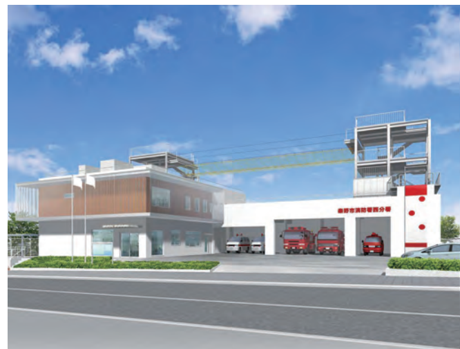
災害時などの出勤体制を強化

築43年が経過し、老朽化している西分署の建て替え整備を行い、救急隊1隊8人を増員します。市民の生命・財産を確実に守り、消防力の充実・強化を図ります。