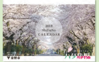
市民の日にも販売

「広く伝えたい秦野の山・水・花」をテーマに、市民の方などから公募した写真で12か月をつづりました。 販売場所 文化会館、図書館、公民館、市役所2階広報課、観光協会、市内書店など 価格 500円