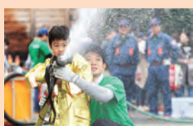
放水を体験しよう

日(日) 午前10時~午後3時 ところ 市役所本庁舎・西庁舎の駐車場 内容 初期消火コンクール、乗車・網渡り体験、消防車と綱引き対決、模擬店など