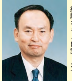
経験をもとに語ります