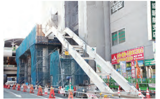
駅やビルとつながるエスカレーター