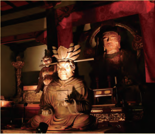
木造十王像等諸仏(宝蓮寺)