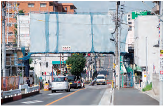
立体横断施設で駅とつながる