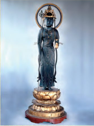
木造十一面観音菩薩立像(極楽寺)