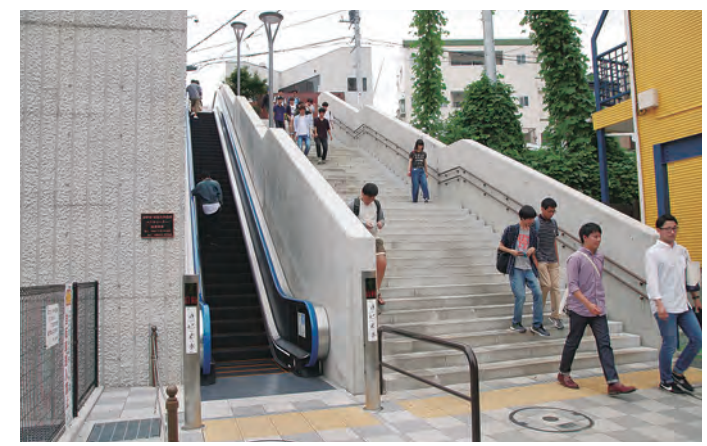
学生や高齢者も安全・快適に

近 道商店街と東海大学の間に急階段にエスカレーターが整備され、学生や高齢者も安心して利用できるようになりました。