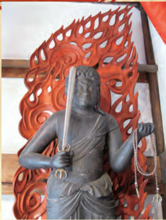
木造不動明王立像(龍法寺)