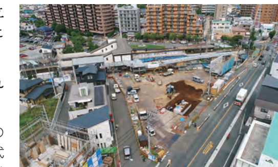
間もなく完成する南口駅前広場

この整備により、交通の円滑化や歩行者の安全・快適な移動を確保するとともに、地域の活性化やにぎわいの拠点づくりを図ります。