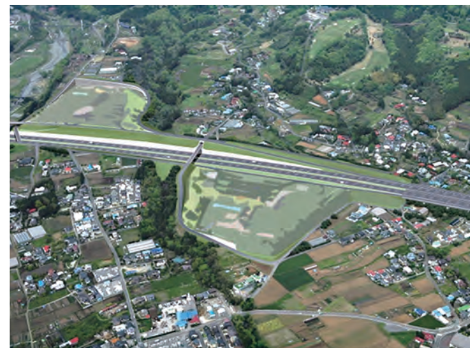
周辺の魅力・付加価値を高める

12mまでの大型の観光バスや特大車が通行でき、市街地を抜けることなく交通の大動脈にアクセスすることができるため、産業・観光の活性化が期待できます。