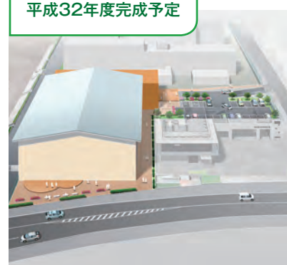
地域と学校の交流が生まれる

さまざまな用途に使用できる集会室などを配置します。また、防災機能を充実させ、災害発生時の対応力を強化します。