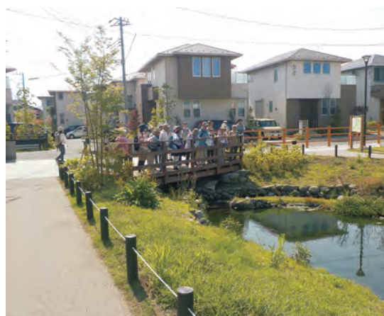
名水を生かしたまちづくり

今泉荒井地区では、湧水を保全、活用した公園の整備とともに、秦野らしい景観や街並みを創出することにより、潤いのある快適な住環境が生まれました。