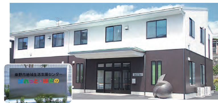
秦野駅北口の平成橋向かい

これまで市内に点在していた障害者の生活相談や就労支援の相談窓口が集約され、利用しやすくなりました。