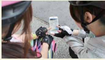
アプリを見るときは安全な場所です

スマートフォン向けアプリを使って観光スポットや飲食店、大山古道などを巡り、合計点を競うイベント「ロゲイニング」。友達や家族と一緒に、秦野の魅力を探しに出掛けませんか。