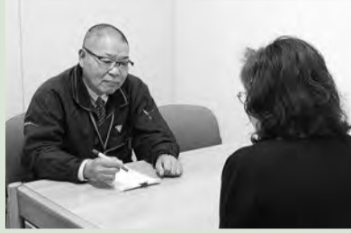
相談員が親身に対応

会場は、 市 =市役所 東 =東海大学前駅連絡所 保 =保健福祉センター 西 =西公民館 鶴 =鶴巻公民館 ほ =ほうらい会館 農 =秦野駅前農協ビル3階 ぱ =市地域生活支援センターぱれっとはだの(本町2-7-25)。各相談とも、祝・休日はお休みします。