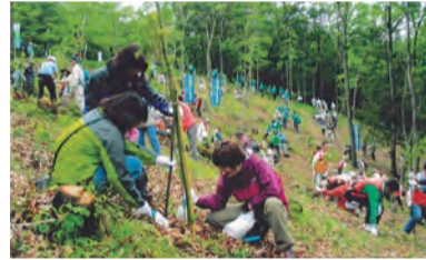
思い出に木を植えよう

時 4月28日(出) 午前10時～午後1時 場 弘法山(権現山) 内 ヤマザクラや