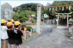
地元の名所を撮影