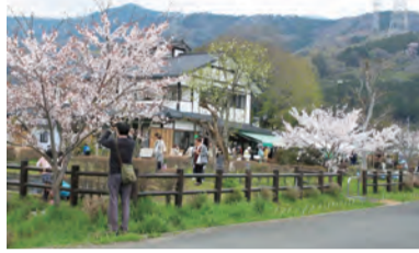
たくさんの人でにぎわう

時 4月7日(出) 8日(日) 午前9時半～午後2時 場 田原ふるさと公園 内 農産物の直売、綿菓子無料配布、模擬店、どむろく(どぶろく)の販売など 問 農産課 ☎(82)9626