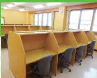
快適な環境で勉強しよう