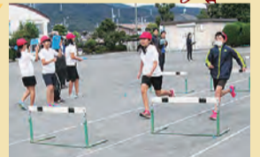
みんなでレベルアップ

ハードル走をグループごとに動画で撮影し、お互いのフォームなどを確認。苦手な子は上手な子のフォームをスロー再生や一時停止などで見ながら、練習に役立てています。