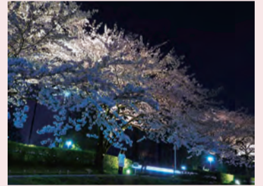
ライトアップされたカルチャーパーク前の桜

とき 4月8日(日)まで 午後6時~10時 ところ 弘法山公園、カルチャーパーク前(水無川右岸)