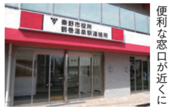
便利な窓口が近くに