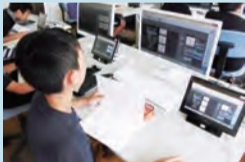
編集をタブレットで

わがまちをPRする「ふるさとCM」の制作を行う授業にタブレットが活用されました。子供たちは、自慢の景観をタブレットで撮影するなど素材を集め、作成したシナリオをもとに、動画の編集も行いました。子供同士でアドバイスし合い、半年以上かけて完成させた30秒のCMは、地域の方に大好評でした。