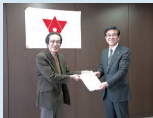
報告書を市長(右)に手渡す行財政調査会長(左)