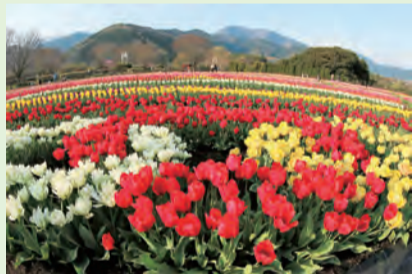
「虹の上の夫婦」 昨年の最優秀賞