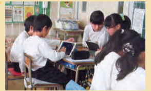
秦野の将来を話し合う

自分の住むまち、秦野の将来について考え、プレゼンを行いました。写真を拡大したり、写真に補足説明を入れたりすることで、より伝わりやすい資料を作っています。