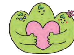
高齢者などを見守る市キャラクター「まなざし山」

健康づくりや技能・経験を生かした活動、地域で役割を持ち交流することは、閉じこもり予防、社会参加、生きがいづくりなどにつながります。健康で生き生きとした生活を送れるよう、サロンなどの地域介護予防活動への支援、介護予防体操を定期的に行う環境づくり、多様な主体による介護予防・日常生活支援総合事業の充実・強化などに取り組んでいます。また、在宅医療と在宅介護の連携を進めます。