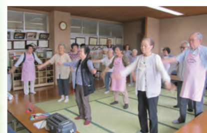
体操教室で健康づくり

65歳以上の方の介護保険料は、3年ごとに改定となります。介護保険制度を安定的に運営し、適切な介護サービスを提供するため、期間中の高齢者人口や要介護等認定者数、サービス見込量を算出し、下表のとおり改定しました。また、高齢者の負担能力により適切に対応した保険料額とするため、所得段階の区分を従来の12段階から13段階にしました。