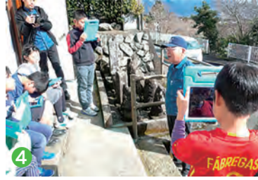
1.タブレットできる