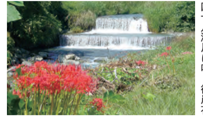
四十八瀬川に咲く彼岸花

時9月21日(金)午前9時渋沢駅改札前集合～桂林寺、四十八瀬川など～午後3時 定40人 費500円 問秦野駅観光案内所☎(80)2303