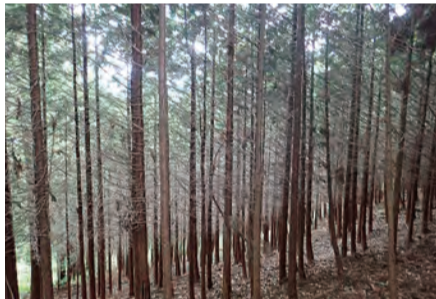
同じ時期に撮影した2枚の写真を比べると、上の写真は適切な間伐と枝打ちにより、太陽の光が多く入り下草がよく育つ。保水性が高く、土砂崩れにも強い

に届け、暮らして潤いを与えてくれる。このバトンを着実に継いでいくことが大切さを知る「山の日」が、今年もやって来る。