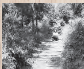
昭和30年頃の柏木林道

とき 8月4日(出)～26日(出) ※18日(出)は午後1時～ ところ 桜土手古墳展示館