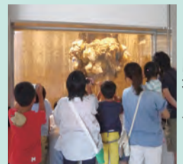
ごみ処理の様子が間近で見られる

とき 8月22日(水) 午前10時～正午 対象 市内在住の小学生と保護者 10組(先着順) 費用 1500円 ※親子1組の入浴料と昼食付き。2000円で子供2人まで可 申し込み 電話のみ受け付け