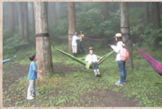
緑の中で癒される

8月11日(出)午前9時緑水庵(蓑毛269)集合～春嶽湧水～午後2時 定員 20人(先着順) 費用 3000円 ※昼食、健康講座あり