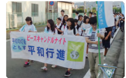
(上) 市平和祈念公園から文化会館へピースキャンドルの種火を届ける平和行進 (右) 種火には広島平和記念公園から採火した「平和の灯」を使う (左) 平和への祈りを込めてキャンドルに火をともし