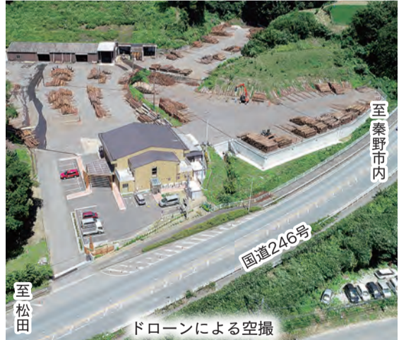
至秦野市内 至松田 国道246号 ドローンによる空撮