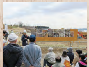
縄文時代の暮らしを知る