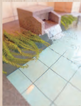
リラックス効果も満点