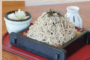
家族や友人と一緒に食べよう