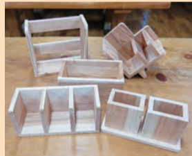
本棚やペン立てが作れるよ

とき 8月11日(出) 午前9時半～正午 ところ 里山ふれあいセンター 対象 親子5組10人(先着順) 費用 300円 申し込み 里山ふれあいセンター☎(75)1961