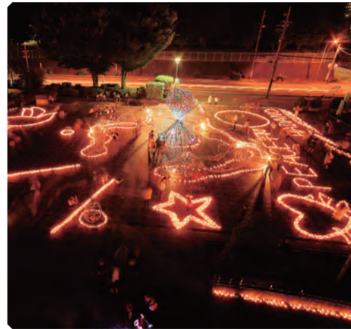
ろうそくの柔らかな光に包まれる文化会館 市民広場(昨年の様子)