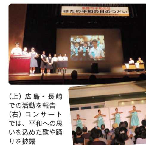
(上) 広島・長崎での活動を報告 (右) コンサートでは、平和への思いを込めた歌や踊りを披露

とき 午後3時半～7時半 ところ 文化会館 内容 ◇第1部 コンサート① ◇第2部 「親子ひろしま訪問団」と「中学生ながさき訪問団」の活動報告 ◇第3部 コンサート②