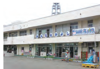
こども園となるみなみがおか幼稚園

園舎は運営する社会福祉法人に譲渡しますが、土地を貸し付けることで年額約350万円の収入があるほか、公共施設の床面積と運営経費の削減効果も見込まれます。