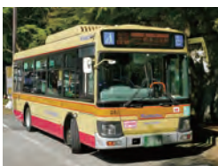
神奈川中央交通(株) 運行事業者は