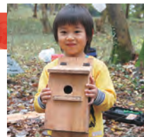
手作りの鳥の巣箱

とき 11月18日(日) 午前9時半～午後2時半 ところ 西大竹地区の森林広場 定員 8組16人(単独参加可) 費用 1組500円