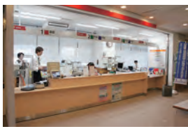
保健福祉センターの郵便局