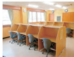
再整備された学習室