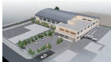
西中学校多機能型体育館イメージ図

西中学校の武道場と西公民館の機能に加えて、地域防災機能を備えた多機能型体育館を、将来的な小中一体化を見据えた規模で整備しています。2年後(2020年)の秋に完成予定となっています。