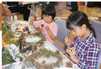
自然の素材でリース作り

とき 11月25日(日) 午前9時～午後3時 ところ 上小学校体育館など 定員 50人 費用 1500円(ハイキングのみは800円)