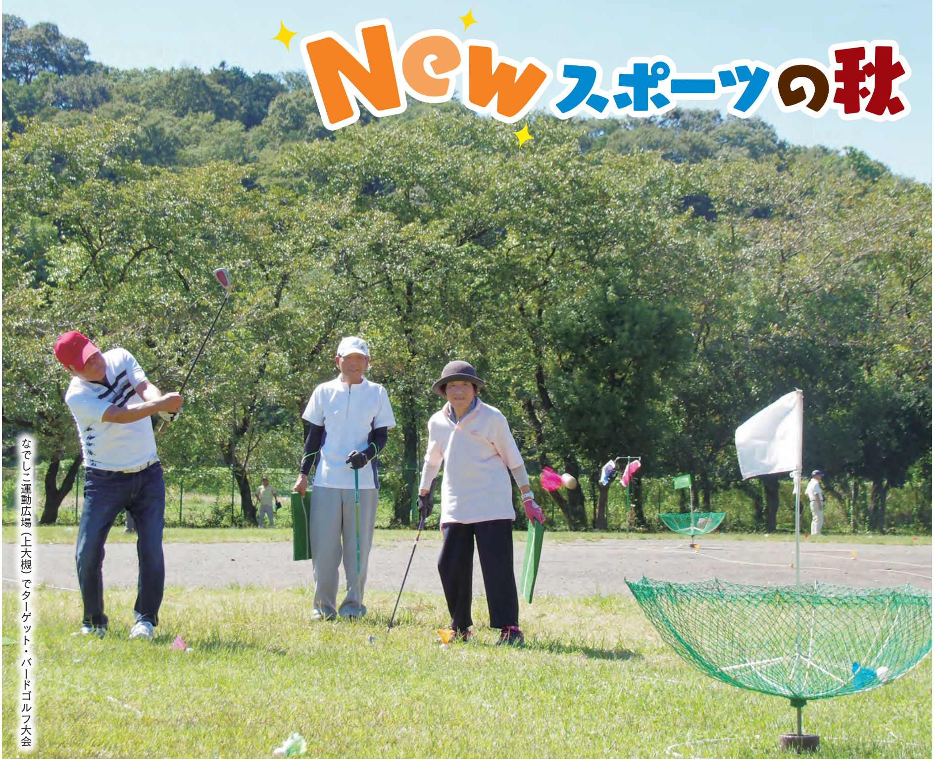
なでしこ運動広場(上大槻)でターゲット・バードゴルフ大会