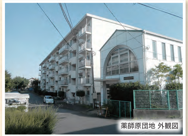
薬師原団地 外観図