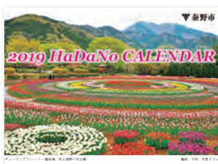
市民の日にも販売

販売場所 文化会館、図書館、公民館、市役所2階広報課、観光協会、市内書店など 価格 500円