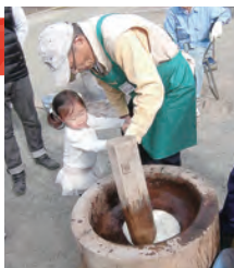
おいしくできるかな

とき 11月11日(日) 午前9時～午後3時 ところ 表丹沢野外活動センター 内容 あじさいなどの苗木の植樹、散策路へのチップまき、ベンチ作り、豚汁などの配布、餅つき体験など