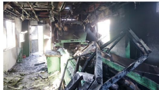
リチウムイオン電池の発火が原因で、リサイクル工場の施設が焼けてしまった事例