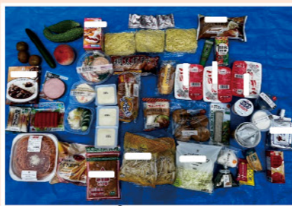
まだ食べられるのに廃棄された食品例

「食品ロス」とは、まだ食べられるのに廃棄される食品のことです。日本における食品ロスは、年間約520万トンとされています。これは、世界中の食糧支援量(約440万トン)よりも約1.2倍も多くなっています。世界中では、約8億人もの人々が飢餓に苦しんでいるにも関わらず…です。「もったいない」ことだと思いませんか?食品ロスを減らすために、日々の生活の中で少しずつ行動することは、とても大切なことです。できることから実践してみましょう。