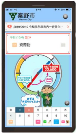
アプリの待ち受けイメージ

ごみ分別促進アプリ「さんあ〜る」は、分別方法を手軽に検索したり、ごみの収集日をお知らせする機能がついた無料アプリです。ダウンロード方法は、次のQRコードからアプリをダウンロードし、インストールしてください。