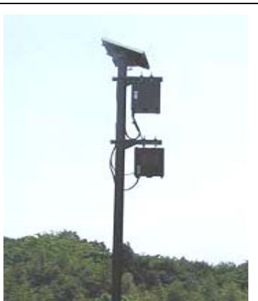
●実際の監視システム

市では不法投棄防止の啓発活動、監視カメラによる監視システムの設置や他団体との連携によるパトロールの実施など、さまざまな防止対策をしていますが、不法投棄が後を絶ちません。