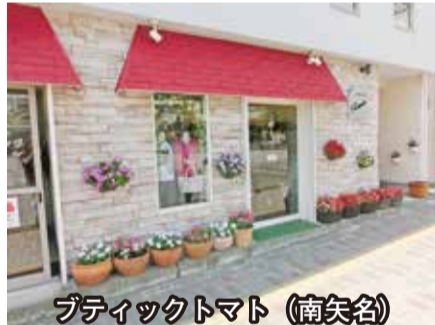
プティックトマト (南矢名)