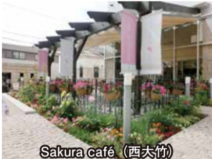
Sakura café (西大竹)