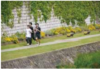
市民手づくりの花壇に心も安らぐ