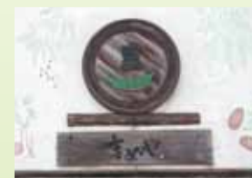
自然素材を使用した個性的な看板