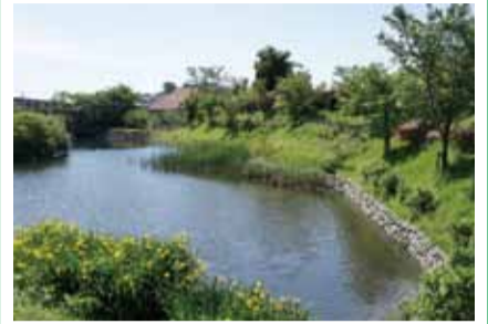
秦野らしい水辺景観を身近に体感