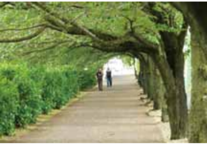
春とは違う緑のトンネルを体験