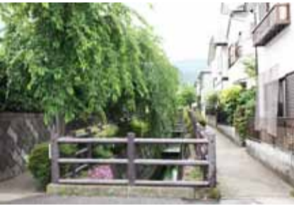
市街地の水路と並木で涼しさを体感