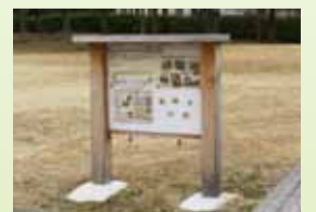
木のぬくもりが感じられる公共掲示板