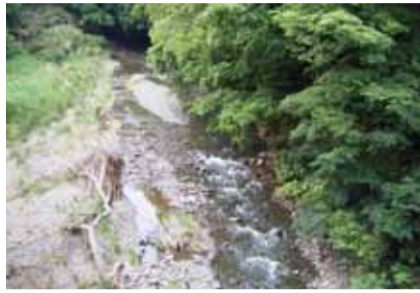
市街地に広がる壮大な涼空間