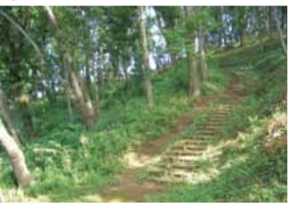
野鳥も訪れる住宅地のオアシス