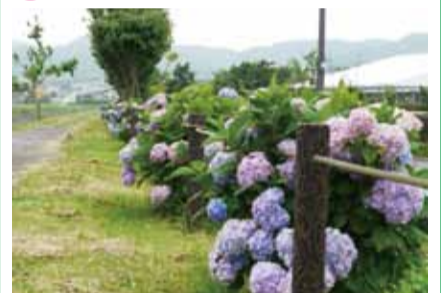
大根川沿いに連なるあじさい散歩道