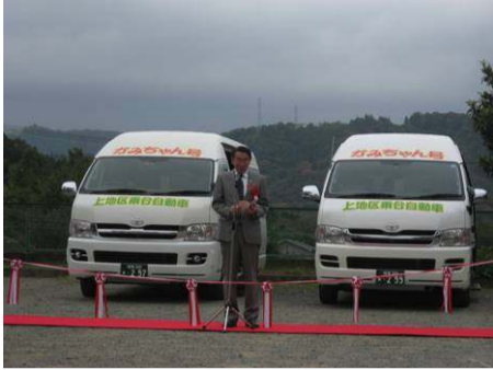
▲秦野市長あいさつ