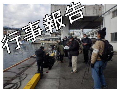
1/8(土) 水辺の野鳥観察 (19人)