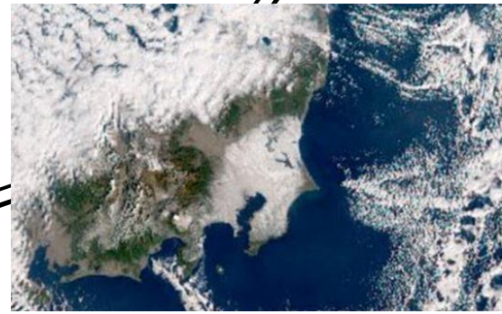
1月7日9時 雪雲と関東地方の積雪 ひまわり8号画像

広場初積雪…1月6日 年明け早々関東地方で大雪が降り、広場も一面真っ白になって9cmも積もりました。美しい景色はまるで別世界でした。 復活の兆し?…1月13日 梅林で本当に久しぶりに、在来種ハラビロカマキリの卵しょうが見つかりました。ムネアカハラビロカマキリ(外来)の駆除の効果が出てきたのでしょうか？ ヤマアカ産卵…1月12日 小鳥の水飲み場で今季初めてのヤマアカガエルの産卵がありました。この冬は、なかなか雨が降らないのでカエルも困っていることでしょう。