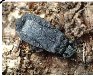
クロヒラタカメムシ