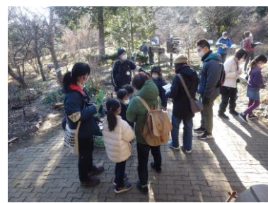
1/22(土) ミニ野鳥観察会 (22人)