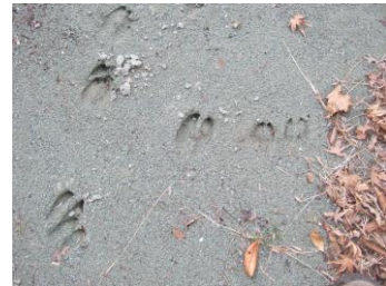
川原に残されたシカの足跡

がんばれ！ちびガエル 冬のさなかの1月から3月、でんじそう池でヤマアカガエルの卵塊が55個も産み付けられました。その卵がおたまじゃくしになり、5月から6月にかけて変態してちびガエルになり上陸して森に向かいます。体長はわずか2cm程。踏まないように足元にご注意を！