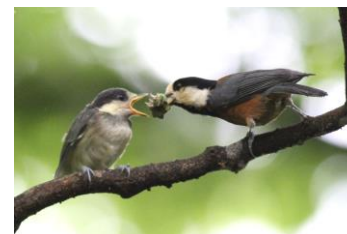
ヒナにエサを与えるヤマガラ

オトシブミのゆりかご エゴノキが真っ白な花を一面に咲かせました。その花の中に、ふしぎな巻物が見つかることがあります。エゴツルクビオトシブミという虫が卵を産んだゆりかごです。この虫が小さな体で、丁寧に葉っぱを巻いていく様子はとても感動的、何度も観察していると、そんな姿に出会うことがあります。