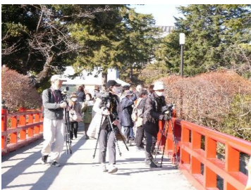
1/6(土) 水辺の野鳥観察～小田原城址公園・御幸の浜(19人)

参加者の声 ・初めての野鳥観察でしたが、ゆっくり歩きながら意識して見てみるとたくさんの種類の鳥たちがいて、皆それぞれ可愛いことが分かりました。慌ただしい日々の中でこのような時間はとても貴重でした。