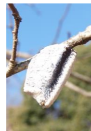
ムネアカハラビロカマキリ卵