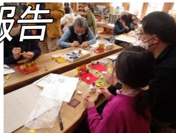
1/27(土) まゆ玉と竹でつくる小さなおひなさま(19人)

参加者の声 ・初めてカイクのまゆに触り、嬉しかったです。子供たちも実際に触れて、ここに蛹がいたんだねと感動していました。ひな人形作りは子供も大人も楽しめました。