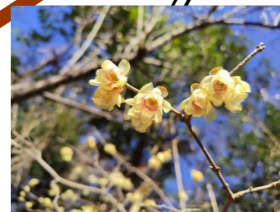
マンゲツロウバイ