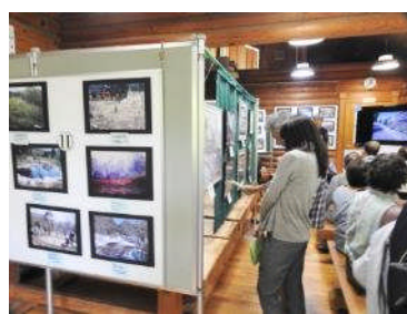
4/29 くずはの家20周年記念 *春のつどい 昔の写真展