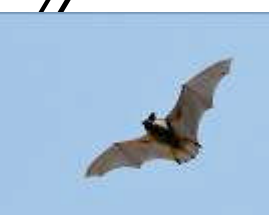
ヒナコウモリ？