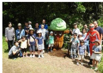
*春のつどい 20周年記念植樹