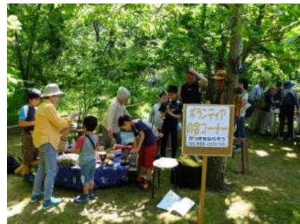
*春のつどい 楽器をならそう