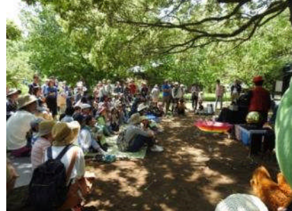
*春のつどい もりりんショー