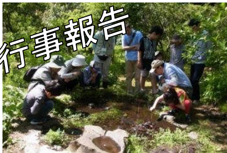
4/22 おたまじゃくしのことしってる? 34人