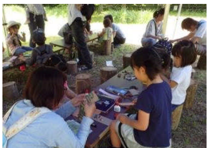
*春のつどい クラフト広場