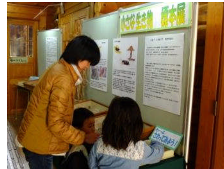
3/23 春の野鳥観察 21人 3/30 楽しいコウモリのお話 35人 3/28~31 小さな生き物標本展 104人