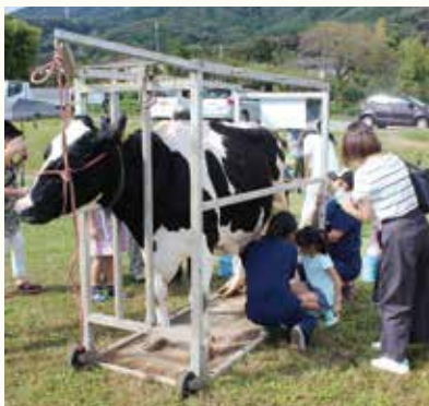
▲乳搾り体験の様子。 貴重な体験!牛さん「温かい」ね。

る家畜の内、乳牛の審査が実施されました。事前に審査が実施された他の家畜を含め、いずれも優秀で甲乙つけがたい立派なものであり、審査は難しかったとのことでした。