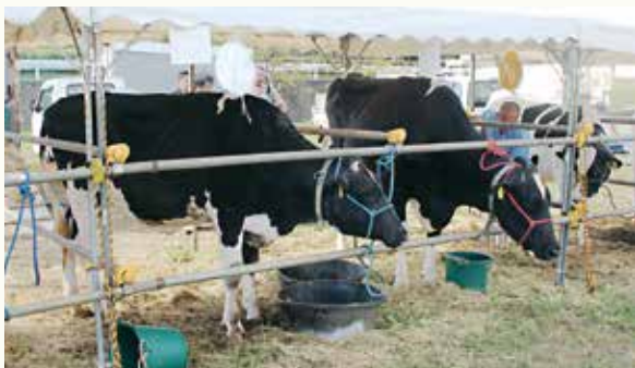
▲審査終了後の様子。 牛さんお疲れ様でした! (左)チャンピオン (右)グランドチャンピオン

10月7日(日)に秦野市畜産まつり(主催・秦野市畜産会)が、田原ふるさと公園で開催されました。当日は晴天に恵まれ、子どもたちをはじめ、大勢の方が来場し大盛況でした。 用意した豚肉バーベキュー、焼きそば、牛乳試飲などは、午前10時に始まったにもかかわらず、正午には完売。動物(子牛・羊・ヤギ)ふれあいコーナーや乗馬体験(ポニー)、乳搾り体験は、子どもたちに大人気でした。 また、同時開催の畜産共進会は、今年で62回を迎え、当日は、多々あ