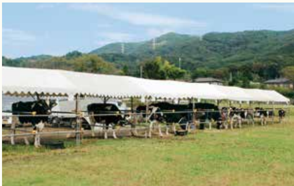
▲開会前の様子。 出品される牛さんたちもソワソワしてる?!

10月7日(日)に秦野市畜産まつり(主催・秦野市畜産会)が、田原ふるさと公園で開催されました。当日は晴天に恵まれ、子どもたちをはじめ、大勢の方が来場し大盛況でした。 用意した豚肉バーベキュー、焼きそば、牛乳試飲などは、午前10時に始まったにもかかわらず、正午には完売。動物(子牛・羊・ヤギ)ふれあいコーナーや乗馬体験(ポニー)、乳搾り体験は、子どもたちに大人気でした。 また、同時開催の畜産共進会は、今年で62回を迎え、当日は、多々あ