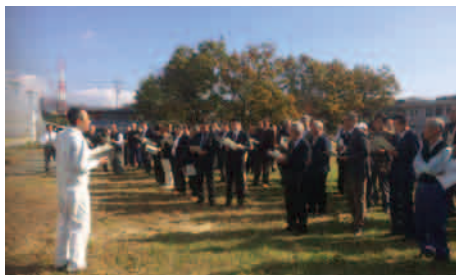
優良事例視察研修会の様子 (赤坂トマト栽培のハウス)

平成28年11月22日に中地方農業委員会連合会が、山梨県甲斐市で優良事例視察研修会を行いました。