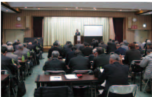
講演する神奈川県農業会議職員

研修の内容は、(一社)全国農業会議所および(一社)神奈川県農業会議の職員を講師に招き、都市農業振興基本計画についてと、農地利用状況調査についてです。秦野市農業委員を始め、各市町農業委員は、委員としての活動に役立てるため、メモを取りながら熱心に聴いていました。