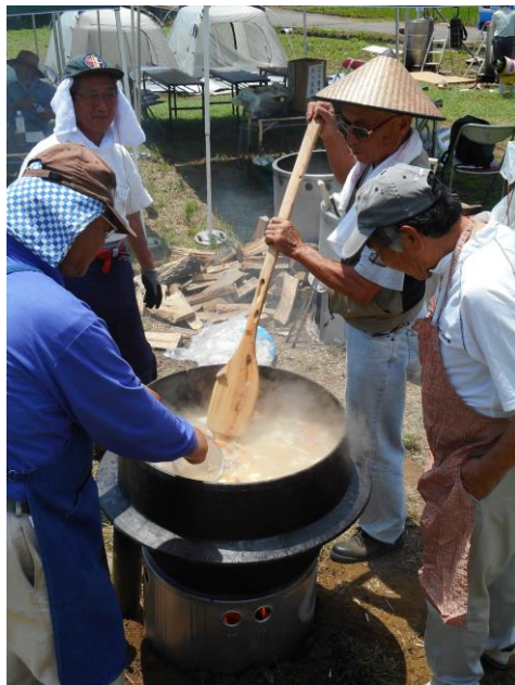
大がまでトン汁を仕込みます