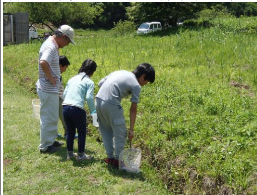
待ち時間に生き物を探す参加者