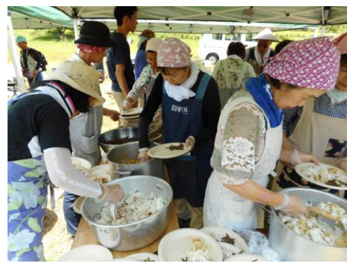
食グループによる配膳の準備