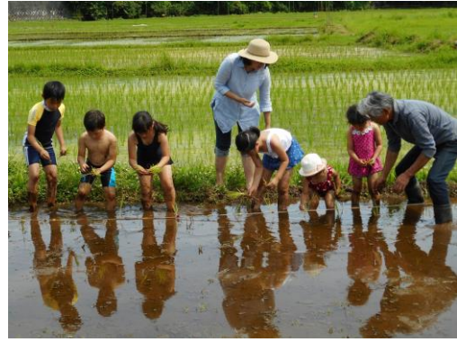
一列に並んで田植えの体験