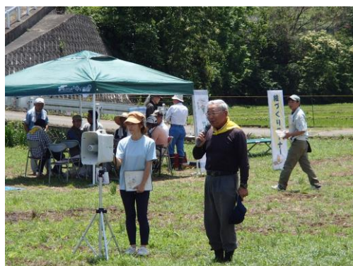
交流会スタート（会長挨拶）