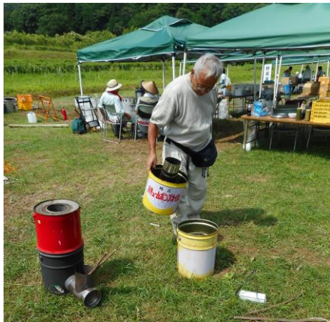
ロケットストーブの仕組みに興味津々