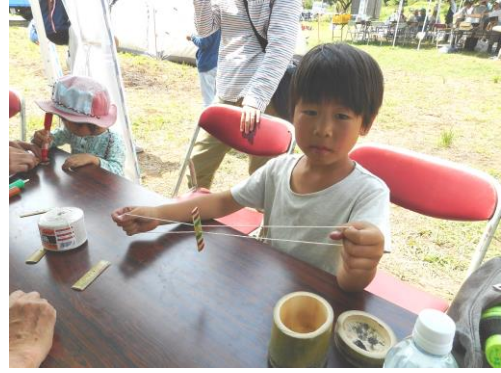
綺麗に色付けされた竹ぶんぶん