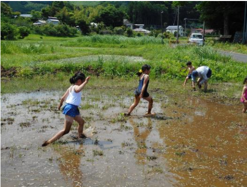
田んぼで泥んこ遊び