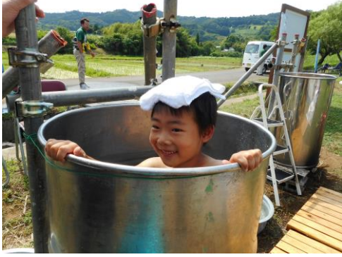
ドラム缶風呂に入浴