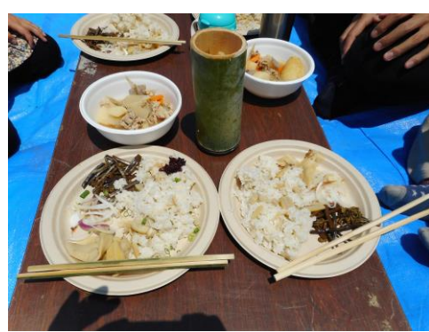
美味しそうに盛られた昼食