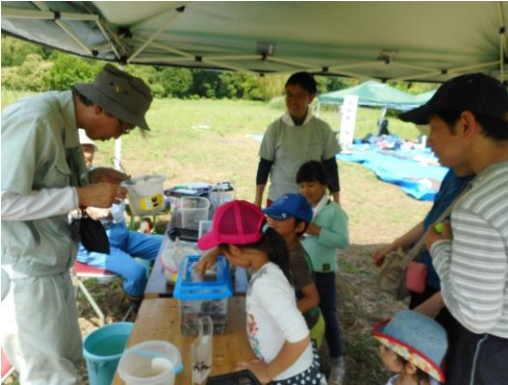
生き物観察コーナー