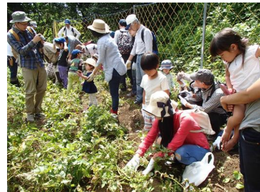
じゃがいも掘り第1会場