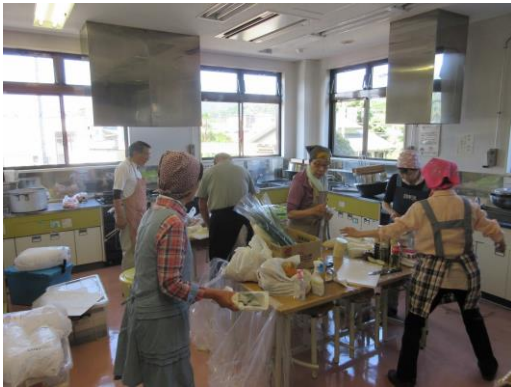
食グループによる昼食の準備