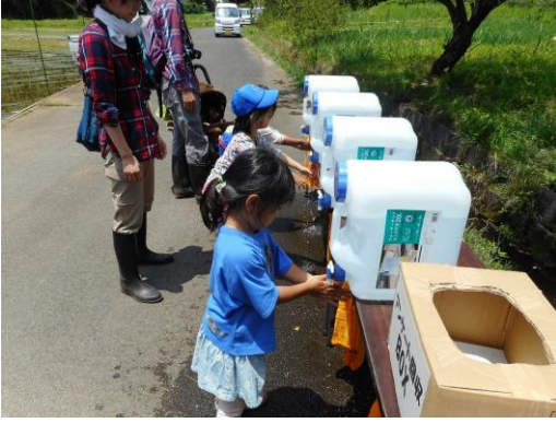
里山コースを終え、手洗い中