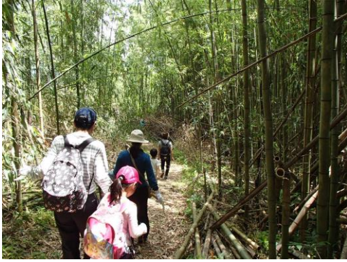
タケノコ掘りへ向かう道