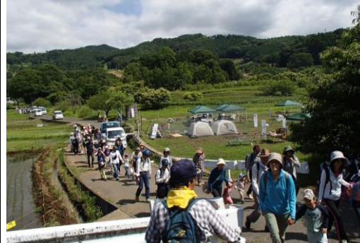
早山コーススタート