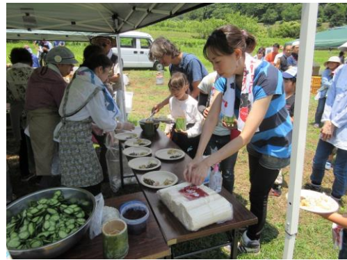
参加者も配膳を手伝います