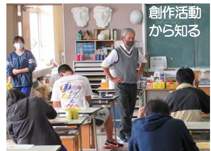
創作活動から知る