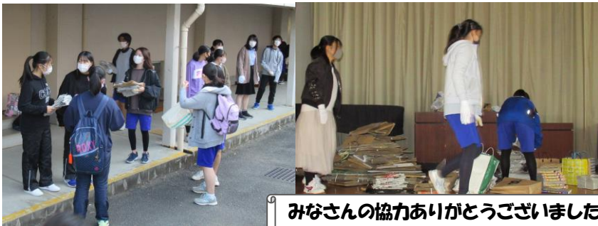
みなさんの協力ありがとうございました。

2学期もあとわずかとなりました。そして12月に入り2020年を振り返り、2021年に向けた準備が具体的に動き出す時期となりました。3年生は進路に向けて、1、2年生は来年度の活動に向けて、みんなの力で認め合い支え合い、たくましく成長を続けています。