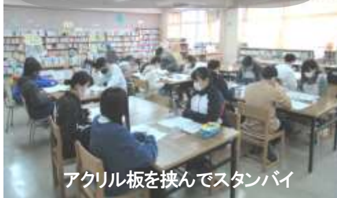
アクリル板を挟んでスタンバイ

図書室に生徒会本部役員、各委員長さんが集まり、放送での生徒総会が行われました。新しい生活様式の中でも、生徒会本部が中心となった取り組みや各委員会での様々な工夫をした活動報告がされました。そして、来年度に向けての前向きな提案がされました。