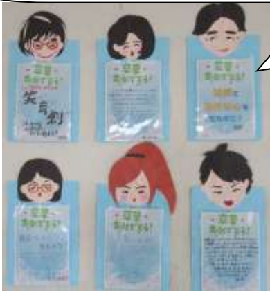
明るい歓声と笑顔があふれました