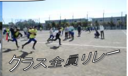
クラス全員リレー