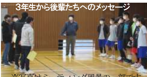
3年生から後輩たちへのメッセージ