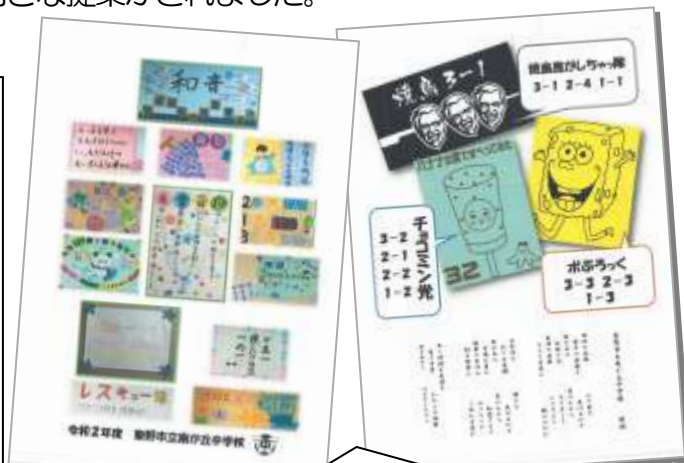
文化委員会の提案で製作された ファイルのデザイン

本日（8日）の3、4校時に3年生の卒業式予行練習が行われました。1、2年生のみなさんは卒業式に出席することができませんが、これまで仲間と共に学校全体をリードしてくれた頼もしい3年生の卒業を学校全体でお祝いしましょう。さて、令和2年度の生徒会スローガンは「努（つとめる）」でした。夢や目標に向かって力を出す。努力する。努める。とても力強さを感じさせる良いスローガンでした。今年は翔丘祭体育の部や文化の部などの大きな行事を行うことができませんでした。その分、毎日の生活、一つ一つの活動が今まで以上に貴重で大切なことに気づくことができました。生徒会本部役員、各委員長さん、そして全校生徒のみなさんの努力で、今までにない新しい生徒会活動を行うことができました。みなさんの誇りにしてください。どんなに困難な状況でもみんなの知恵と力を合わせることで、可能性が広がることを今年度の取り組みで学ぶことができました。みなさんの主体的な力に感心するばかりです。ありがとうございます。（学校長のことばより）