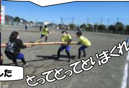
とってとってせほぐれ