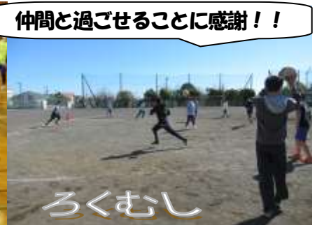
仲間と過ごせることに感謝!!