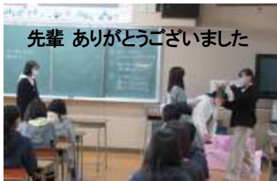
先輩 ありがとうございます

3/8 放課後、各部ごとに、1、2年生から3年生に感謝を伝えるミーティングが開かれました。目標に向けて頑張る3年生の後ろ姿に、いつか追いつき、追い越せるように頑張ります。