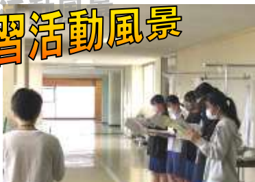
歌う向きを揃えて合唱パート練習