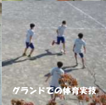
グラウンドでの体育実技