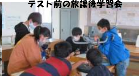
テスト前の放課後学習会