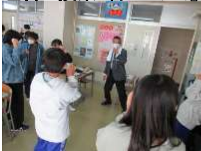
実験・体験を通して学ぶ