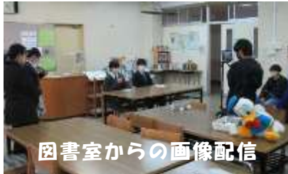
図書室からの画像配信