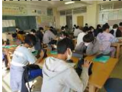
タブレットを使って学ぶ