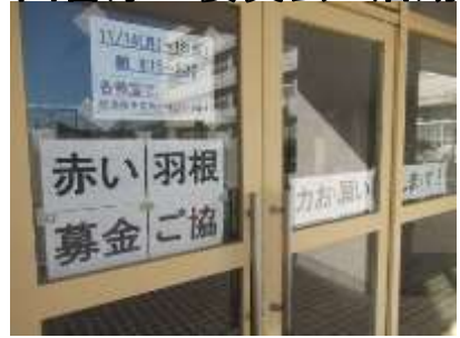
社会貢献を通して学ぶ