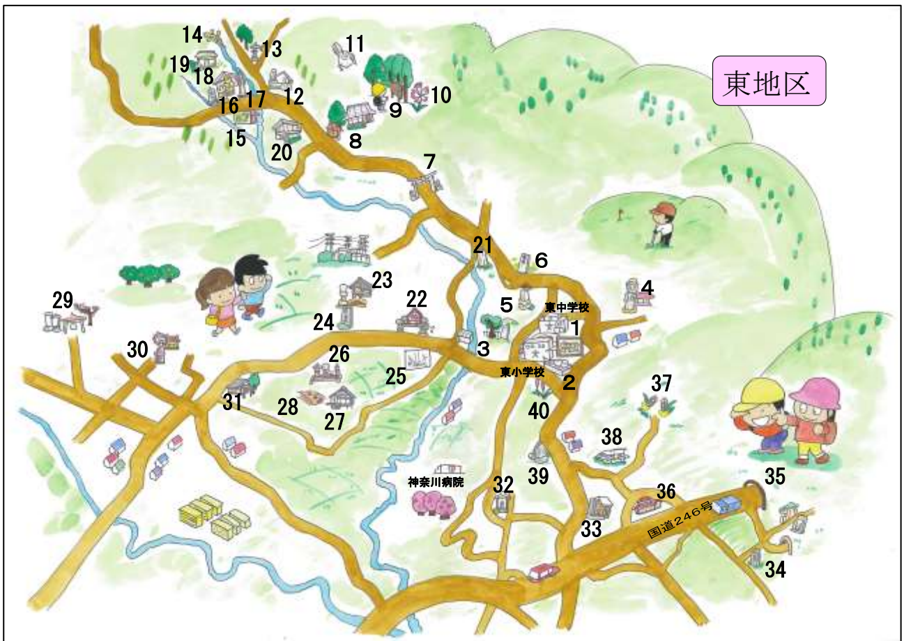
ひがしちく 〈東地区〉

ちゅうい ぼしよ すうじ まる しゃしん じぶん は注意することがある場所です。また数字に丸がついているところは写真をとるときに自分 い まつえい を入れて撮影してください。