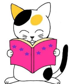
図書館公式キャラクター【みるみる】