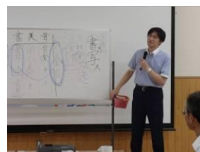
目からウロコの講義

今、ひそかに書写や毛筆が見直されています。広島県熊野町では、小学校1年生から書写の授業を行っており、児童の集中力が増し、他の授業にもいい影響が出ているとの報告があります。この秋、青山先生に倣って「美文字」先生を目指してみませんか？