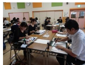
先生達も一生懸命