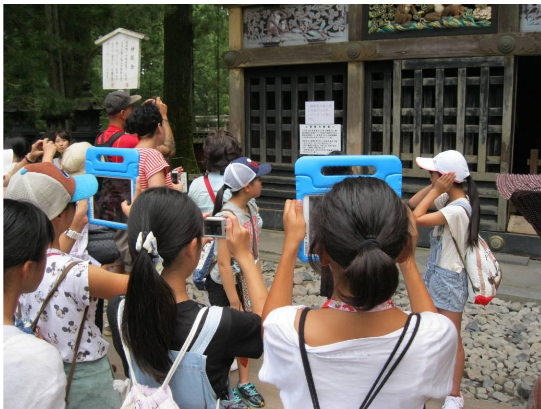
修学旅行でタブレット端末を使う上小学校の子どもたち

今年度、上小学校ではICT活用を学校研究のテーマとして、学校全体での組織的な実践研究に取り組んでいます。具体的には、タブレット端末を用いてドリル学習 (eライブラリアドバンス) を行ったり、授業支援のアプリケーション (ロイロノート・スクール) を、自らの考えや思いを伝え、学び合うための補助ツールとして活用したりしています。