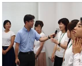
アクティブ・ラーニング を体験

「エコキッズ」に関わる教員対象の研修でしたが、多くの方に受けていただきたい貴重な講義でした。1枚のTシャツは、どれくらいの綿花が使われており、どれくらいの畑で栽培されているのか。安価なものほど、綿花畑で酷使されている子どもたちにつながります。日常の一コマから環境について深く学ぶのも大切なのだと再認識しました。