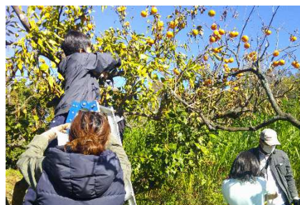
元気っ子777 みかん狩り