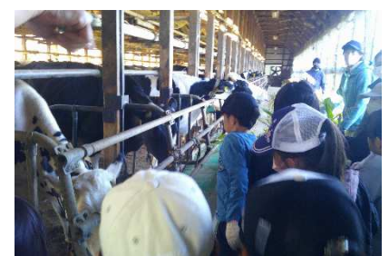
元気っ子777 牧場体験