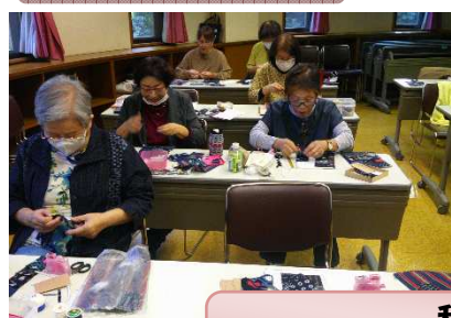
和布で作る スマホを入れるポシェット