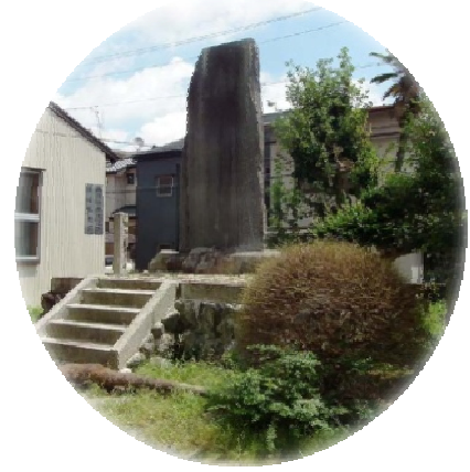
安居院庄七頌徳碑 （静岡県浜松市）

大正7年、従五位に叙せられた記念として、秦野市立本町小学校に記念碑が建立されています。