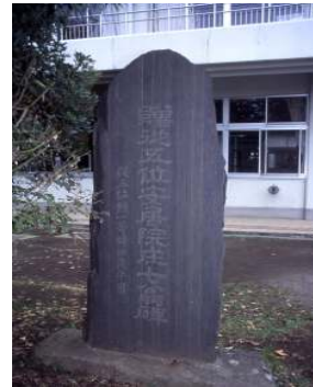
安居院庄七頌徳碑 （本町小学校）