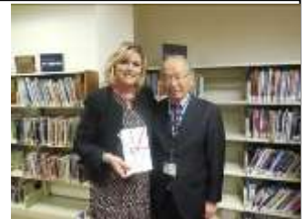
パウエル教育長と