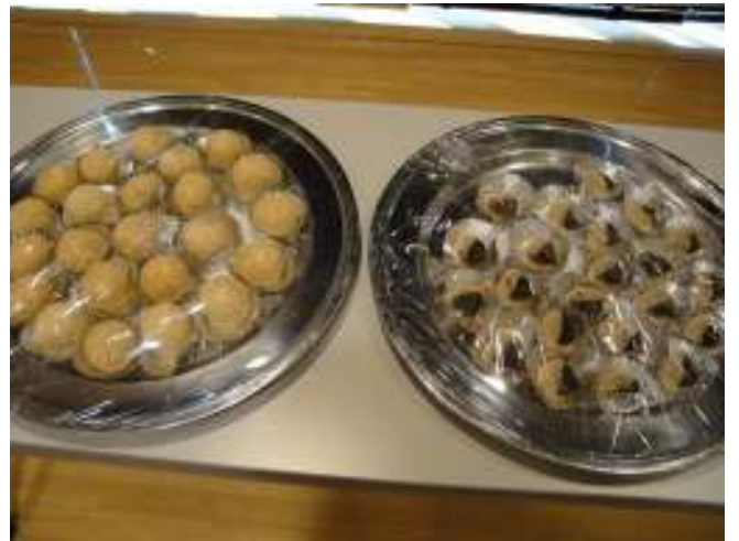
ゴマ団子と栗もち