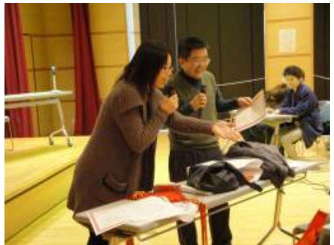
参加者にクイズの回答を当てていく