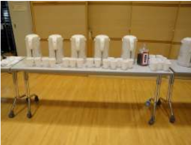
交流会用に用意された中国茶