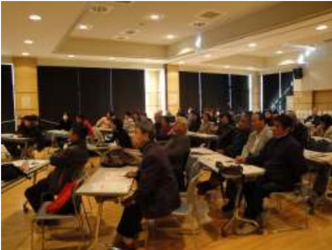
会場の参加者の様子