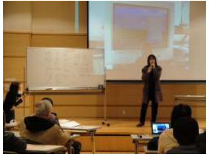
スクリーンに写真を写しながら春節の説明をする