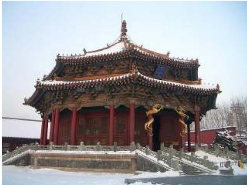
瀋陽故宮 大政殿（2004年ユネスコ世界遺産登録）