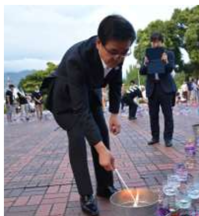
メインキャンドルから採火した火を周りのサブキャンドルに点火