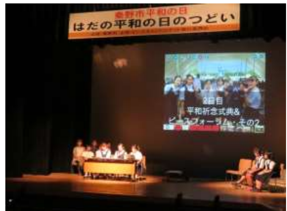
中学生ながさき訪問団は、 タブレット端末を操作しながら活動報告