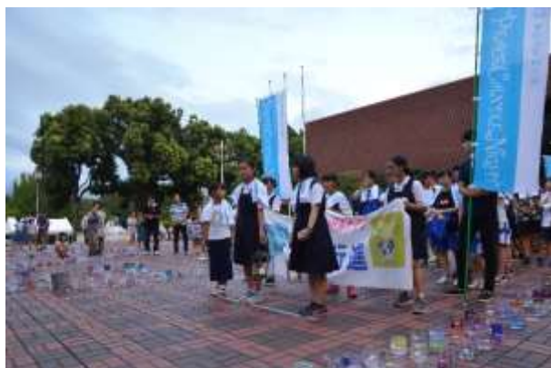
平和行進が文化会館に到着

そして、サブキャンドルの火を使って、イベントサポーターや来場者が協力して、会場に設置した約 10,000 個のピースキャンドルに火をともしました。