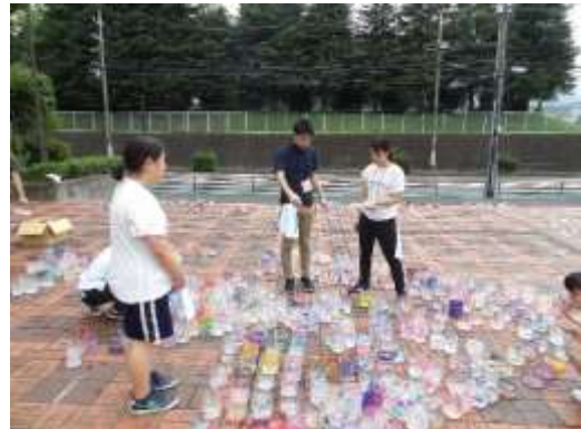
レイアウト図に沿ってキャンドルを設置する