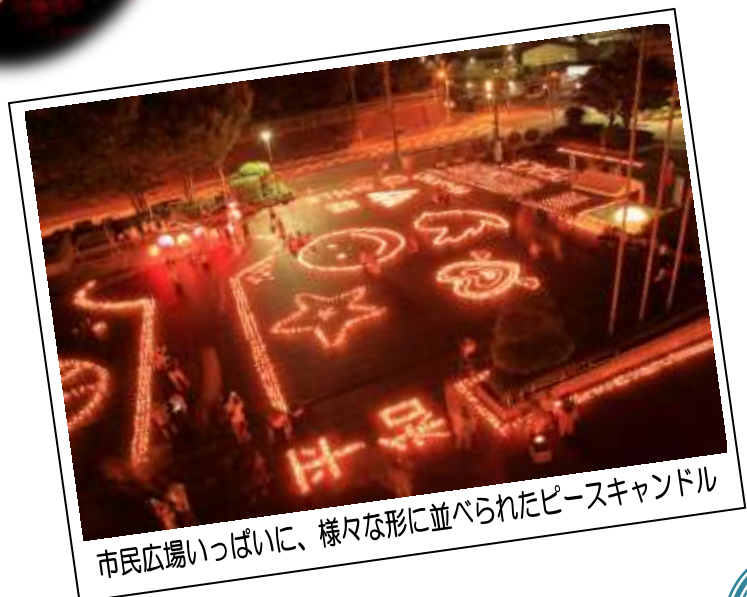
市民広場いっぱい、様々な形に並べられたピースキャンドル