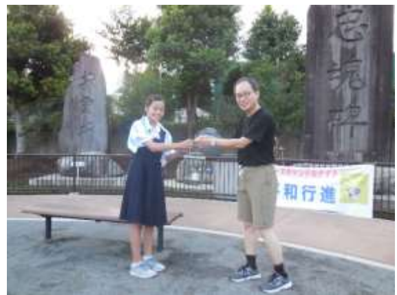
「平和の灯」とともすランタンを手渡される行進代表者