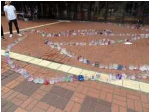
「平和」をイメージして、様々な形に並べられたキャンドル