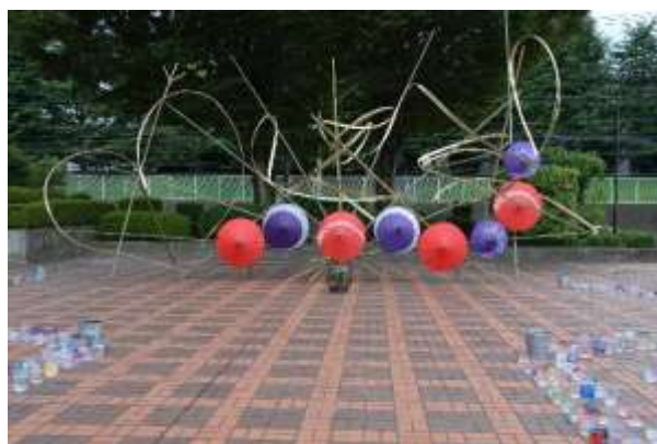
Bamboo Project Japan 製作の竹製オブジェ