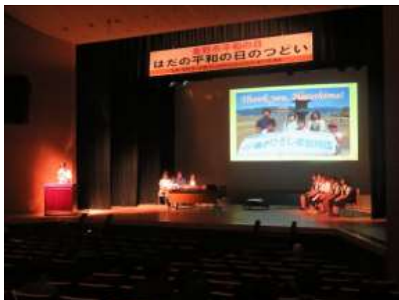
親子ひろしま訪問団は、 団員5人が、スライドに合わせて活動報告