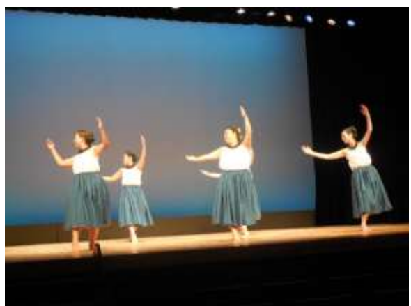
第3部(コンサート)の様子