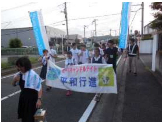
種火を先頭にメイン会場へ向かう平和行進