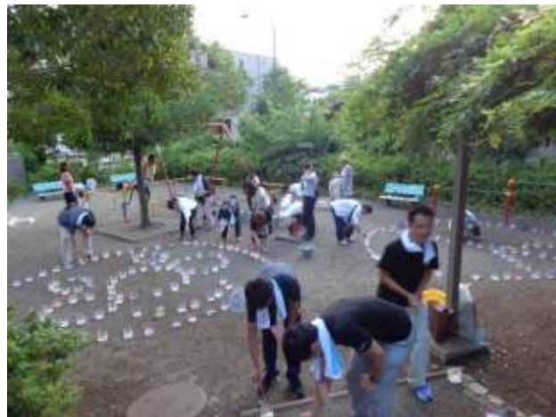
つるまき北公園に設置されたピースキャンドルと点灯に参加する来場者