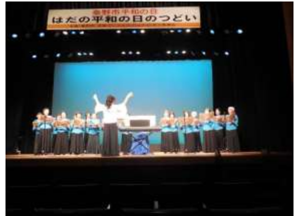
第1部(コンサート)の様子