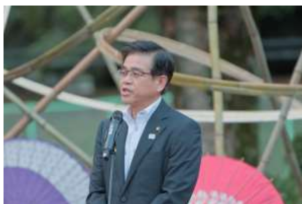
挨拶する高橋市長