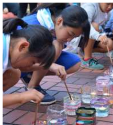
サポーター、来場者も点火に参加