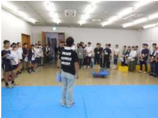
ガイダンスを聞くサポーター

メイン会場となる文化会館に、イベントサポーターが集合。キャンドル設置についての説明を受けたあと、ボランティアリーダーの大学生の指示のもと、設置作業に取り掛かりました。