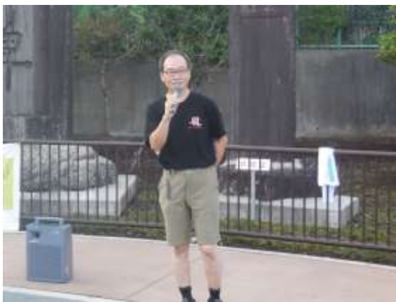
出発を前にあいさつをする細腰副委員長