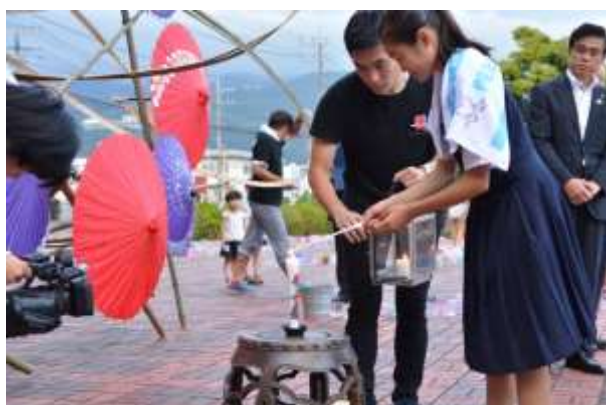
行進参加者代表がオブジェ中央のメインキャンドルに点火