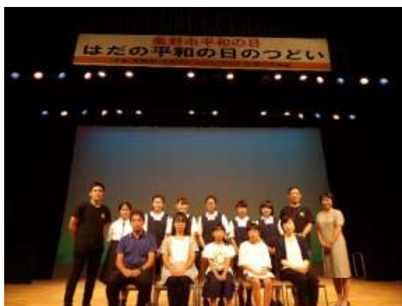
最後に全員で記念撮影