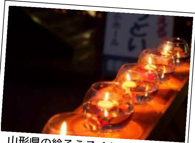
山形県の絵ろうそくも会場を演出