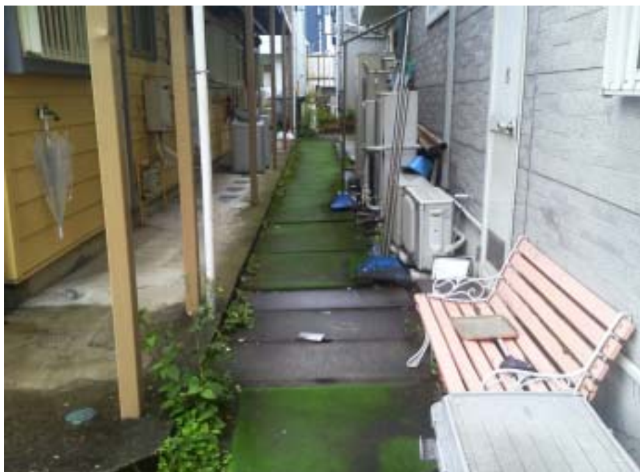
写真 1：路地裏の後田用水 一部には手すりなどが残っている

時代によって姿を変えつつこの街を見守り続けてきた後田用水は、この場所がのどかな田園地帯だったことを現在でも我々に語り続けているのかもしれない。