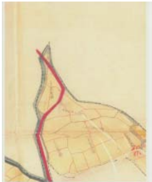
図3：取水部 左側を下って行くのは田中川、左下に少し見える川が大根川（水色が水路、赤色は道）

昭和期に入ると現在の小田急線が開通し、まばらながらも駅前に人家などが建ち始め、時期が下ると徐々に商店なども見られるようになってきた。その頃からか、おそらく水田の宅地転換によって田んぼから田んぼへ水を受け渡していくそれまでの仕組みでは不十分になってきてしまったために水路を設けそこに水を流すようになったのだろうと推測できる。