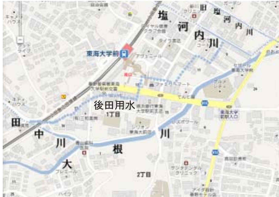
図2：現在の駅前と後田用水の推定流路 太い点線が後田用水

るからであり、塩河内川との合流点 iii が近くなると再び水路の形に戻り、塩河内川に合流する（図4）。つまり田んぼそのものが用水路であり、これが明治期からしばらくの間の後田用水の姿である。