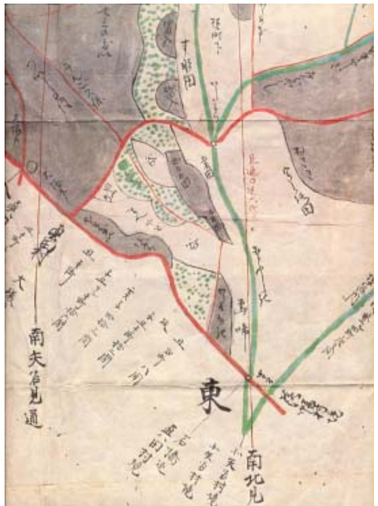
図 1：江戸期の絵図「宇し路田（うしろだ）」の地名が見える

この三本の川からの豊富な水でこの場所は潤っていたかのように思えるが、後田あたりは川の水位から少しだけ高い所に位置していたため水を引くことができなかつたためか、田中川から後田を經由し塩河内川へバイパスする水路が作られたようである。後田という名も「水が揚げられない、奥まったところにある」などの理由でつけられた名であるようにも見える。この水路には名称はないようだが、ここでは便宜上「後田用水」