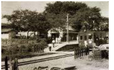
洪 沢 駅