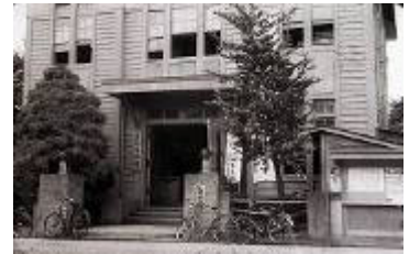
秦野地区警察署 (駐車場: 栄町5-1)