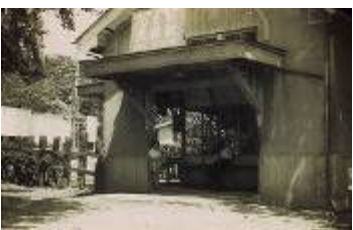
大 根 駅 (東海大学前駅)