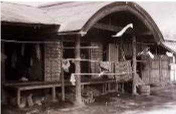
堀学校 (堀山下児童館: 堀山下843)