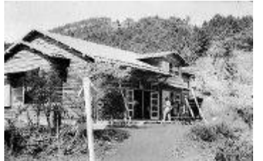
ヤビツ山荘 (ヤビツ峠バス停東上段)