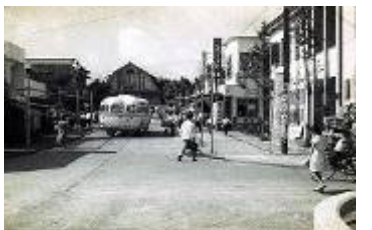
大秦野駅 (秦 野 駅)