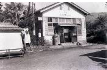
北秦野郵便局 (菩提399)