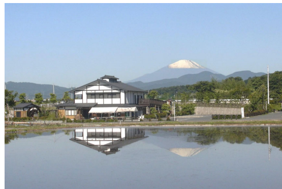
田植え前の水田の水面に写る逆さ富士

応募された写真は、秦野の姿を未来に伝える資料として、市史資料室で大切に保存します。