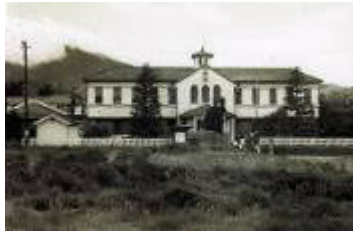
日本赤十字病院 (秦野市役所: 桜町1-3-2)