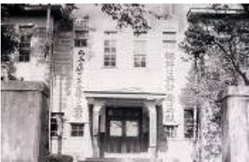
南秦野町公民館/南秦野農業協同組合(南公民館: 今泉598)