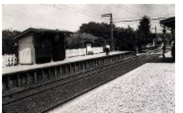
鶴 巻 駅 (鶴巻温泉駅)

市史資料室には、皆さんのちょっとした疑問に答えてくれる、秦野の歴史や自然に関する本をはじめ、神奈川県史や県内・県外の自治体史などが数多く揃っています。郷土史の研究や夏休みの自由研究など、利用の仕方は様々です。皆様の御利用をお待ちしておりますので、お気軽にお立ち寄りください。