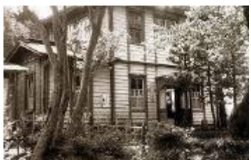
市役所大根出張所 (大根公民館: 南矢名3-16-22)