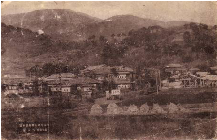
小田原急行鶴巻温泉駅 温泉旅館 つる家 (絵葉書)