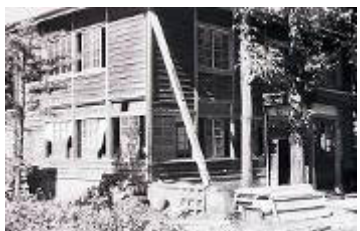
市役所北出張所 (菩提駐在所: 菩提459)