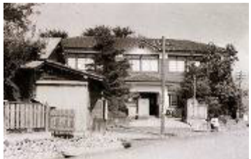
西秦野町役場 (駐車場: 並木町3-1)