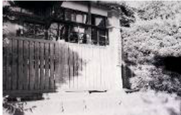
市役所東出張所 (東公民館: 東田原1538)