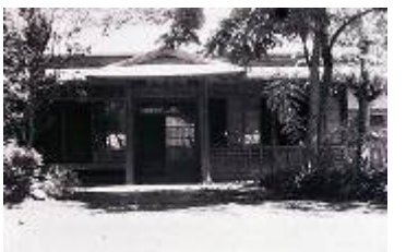
北公民館(興村寮) (北小学校正門北側)