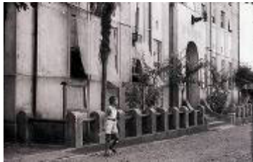
秦野市役所 (市史資料室: 寿町3-12)