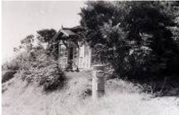
東秦野郵便局 (寺山232)