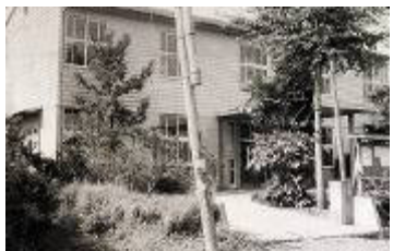
市役所南出張所 (駐車場: 今川町7-31)