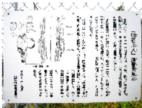
西八木海岸の「明石原人」腰骨発見地の看板