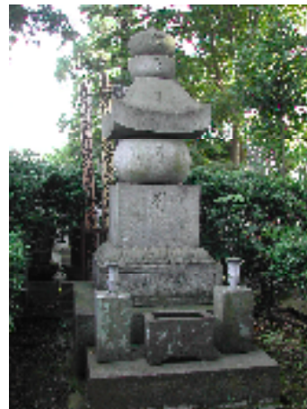
今泉太岳院の直良家墓所

昭和 60 年 11 月 2 日、83 歳の生涯を終えた直良の遺骨は同月 8 日、秦野市今泉の太岳院の墓所に納骨されました。戒名は「秋成院洪化清信居士」。ひときわ大きな五輪塔です。