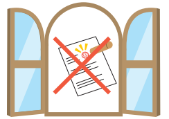
不利な契約の取消し

認知症などで、1人で決めることができなくなったときに、本人を守ります。本人に代わって貯金を下ろしたり、不動産を売ったりしてもらえます。また、不利な契約を取消してもらえます(家庭裁判所が選んだ成年後見人などが行います)。