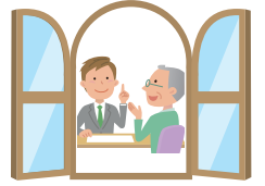
福祉サービスの手続きや契約

将来、認知症などで、1人で決めることができなくなったときに、本人を守ります。代わりにしてほしいことを前もって決めておいて、自身が選んだ人と契約しておきます。