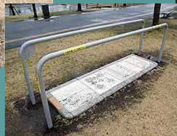
〔足裏のツボを刺激〕