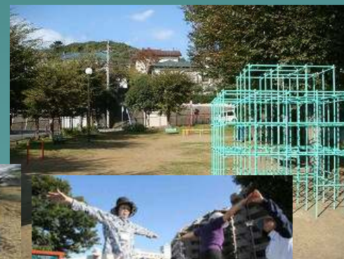
〔バランスで健康づくり〕