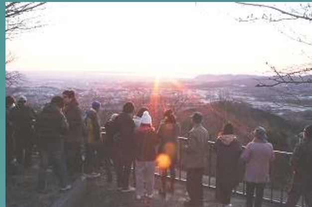
〔弘法山からの初日の出〕