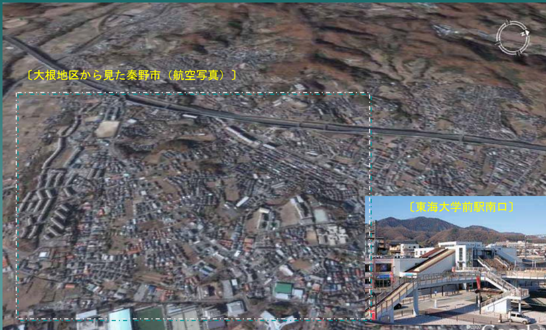
〔大根地区から見た秦野市（航空写真）〕