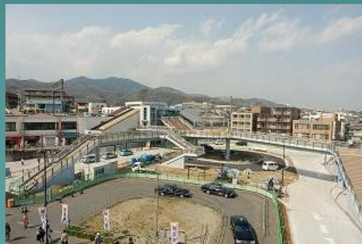
〔東海大学前駅周辺(南北)〕