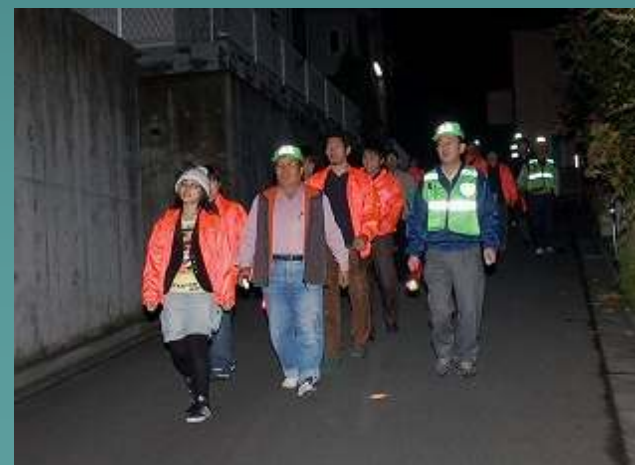
〔防犯パトロールの様子〕