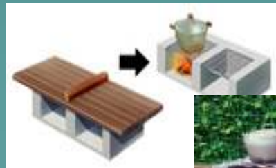
〔(例)かまどベンチへ〕