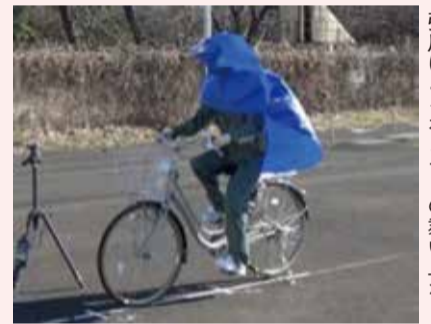
強風によるポンチョの舞い上がり