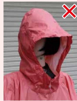
フード調整機能を使用しない場合