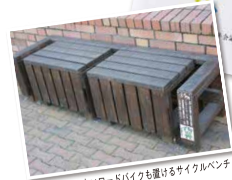
▲スタンドのないロードバイクも置けるサイクルベンチ