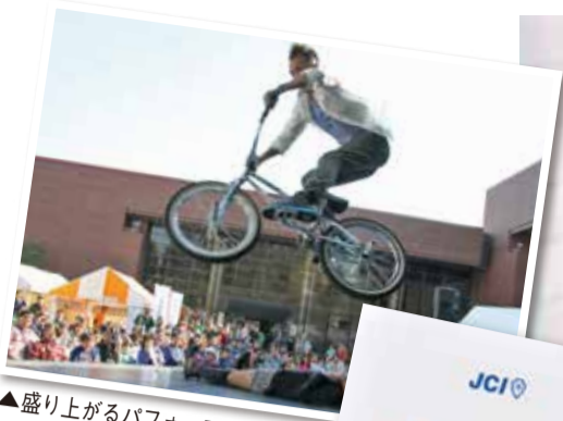
▲盛り上がるパフォーマンスショー