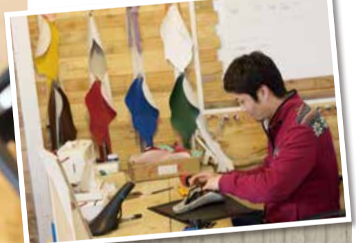
▼一つ一つ手作業で丁寧に