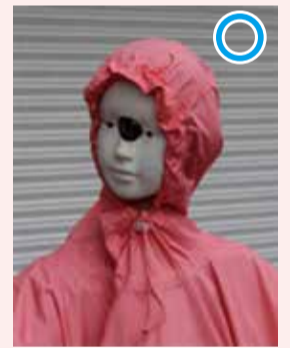
フード調整機能を使用した場合